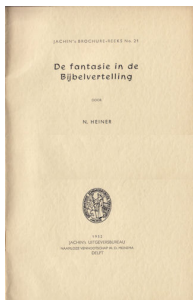
De fantasie in de bijbelvertelling 15 blz., [1ste druk 1952] Uitgever W.D. Meinema N.V., Delft Open boekje

www.digibron.nl/search/detail/012dc9aa1c25ac132d30517f/ik-ben-maar-een-beginnelingetje/6