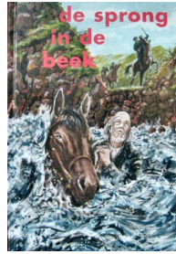
De sprong in de beek 43 blz., [1ste druk 2006] Auteur C. van Rijswijk

't Perkoetoet mysterie 191 blz., [1ste druk 1960] Auteur M.A.M. Renes-Boldingh Bandontwerper Hans Borrebach