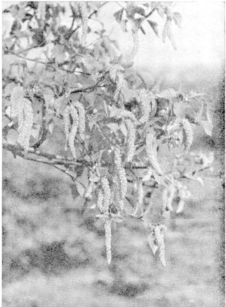
Berketak met katjes.

de manlijke katjes beginnen de korte stam-