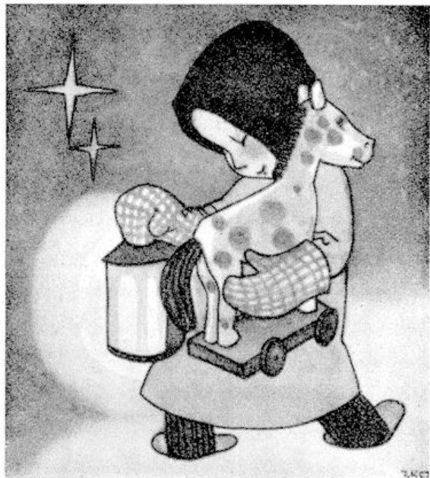
„Ik draag je, licht.“

En we nemen ons voor, de eerste Zaterdagmiddag na de 20e Maart vrij te houden voor een reisje naar de residentie.