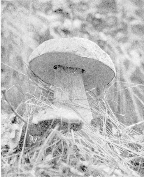
Bittere Boleet, een gaatjeszwam.

de honderden verschillende soorten, die alleen al in ons kleine land voorkomen zijn pas met zekerheid te herkennen wanneer we hun vruchtlichamen in handen hebben. Wat zijn er ook een ongelooflijke massa vormen! Echte „paddenstoelen“ vinden we, met een steel en daarbovenop een meer of minder grote hoed, uitgespreid als een parasol. En onder hen zien we al dadelijk vele verschilpunten; er zijn er met talloze fijne gaatjes aan de onderzijde, anderen dragen daar een groot aantal tere plaatjes of lamellen en ook komen we er tegen, wier onderkant geheel bezet is met een onnoemelijk getal stekeltjes. Doch ook geheel andere verschijningen ontmoeten we op onze wandelingen. Van paddenstoelen hebben die eigenlijk niets meer weg. Neem bijvoorbeeld de vogelnestzwammetjes, steel en hoed hebben zij verwisseld voor een klein bekertje, dat we vinden plat op de grond of tussen rottend blad. En binnenin dat bekertje, zowaar, daar schijnen een paar kleine eitjes te liggen.