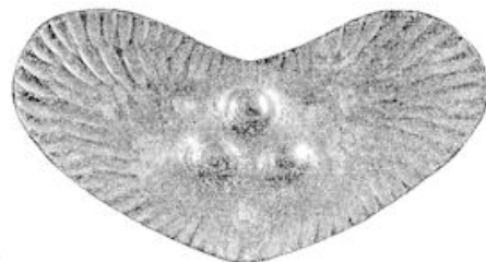
Broche in tombakmetaal gedreven.

De mogelijkheden bij de metaalbewerking zijn overigens evenzeer talrijk als beperkt. Wie bv. een schaal wil maken uit een plaat koper zal niet anders dan op twee manie-