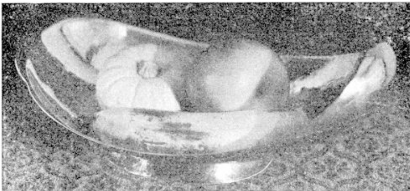
De vruchten liggen als zaden in een reusachtige bolster gevat.

persoonlijk karakter der machinale productie de eigenschap der bezielde voordracht bezit, een eigenschap welke de hechtste ondergrond is voor elke zuivere kunstuiting en waaraan deze laatste haar kosmische betekenis ontleent.