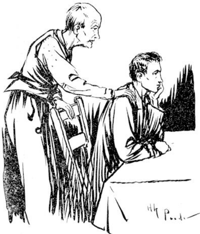
Me jongel.. jij hebbe vandaag je oue vader wat leerd.

De oude Lohuis kan weer danken. En de jonge Lohuis dankt mee..