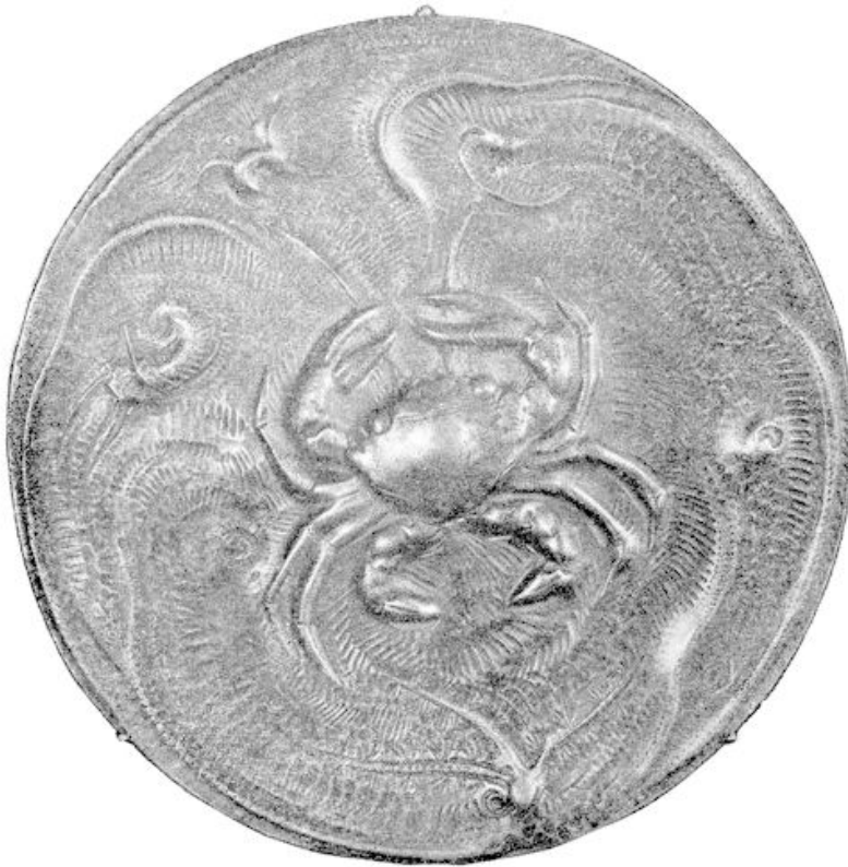
Gedreven deksel, een suggestie van de zee.