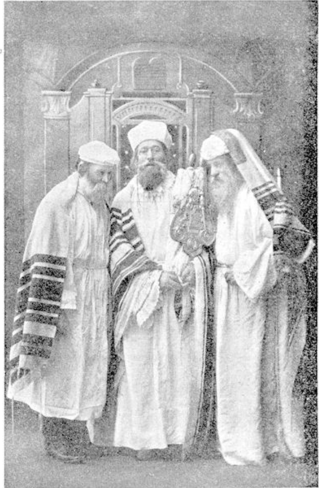
Joden in de Synagoge op Grote Verzoendag.

Wat echter laat het gelden? Den God aller menschenkinderen, Niet meer, niet minder.