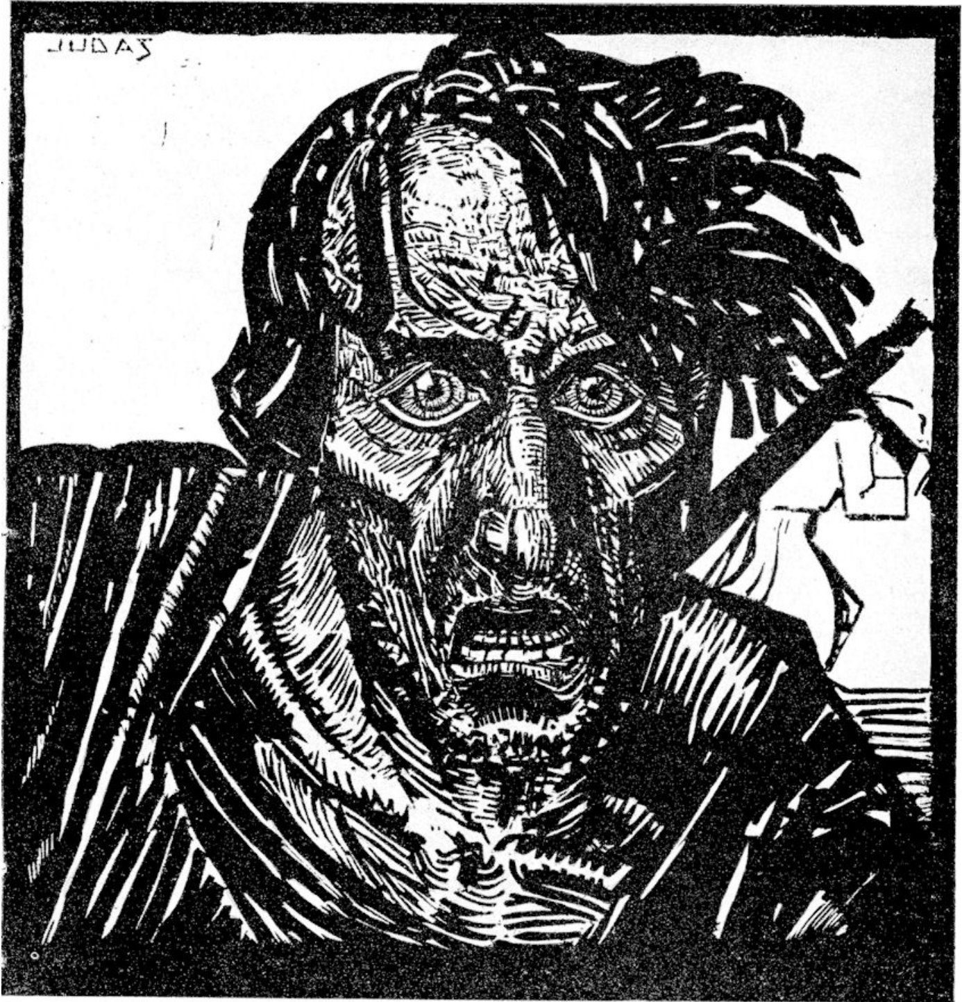
JUDAS' WANHOOP. Van Marius Richters — Rotterdam.

Toen heeft Judas, die hem verraden had, ziende dat hij veroordeeld was, berouw gehad, en heeft de dertig zilveren penningen den overpriesteren en den ouderlingen wedergebracht, zeggende: Ik heb gezondigd, verradende het onschuldig bloed! Matth. 27 : 3 en 4.