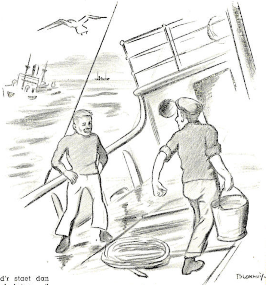
„Jooj, d'r staet dan een harde bries....“