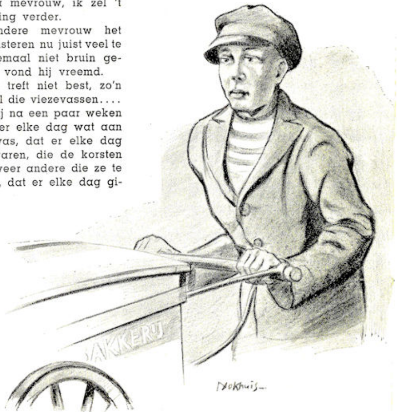
...als hij zijn kar door de hete straten laveerde.....