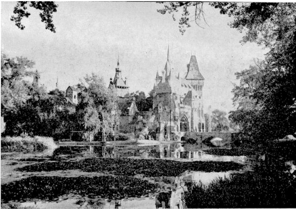
Het Vadjahunyad-kasteel te Boedapest; momenteel ingericht als landbouwmuseum.