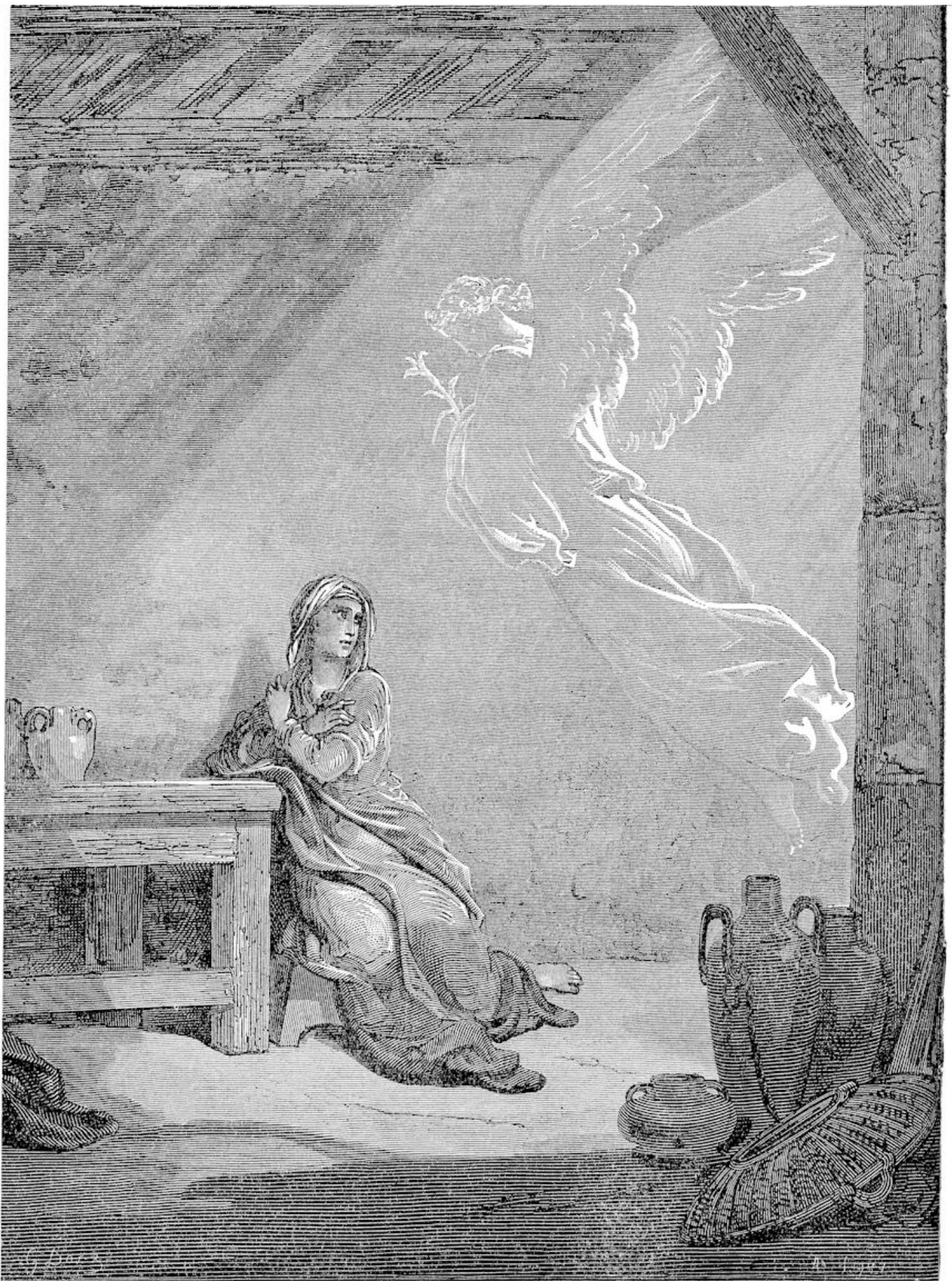
De boodschap aan Maria (tekening van Gustave Doré, 1832-1883).