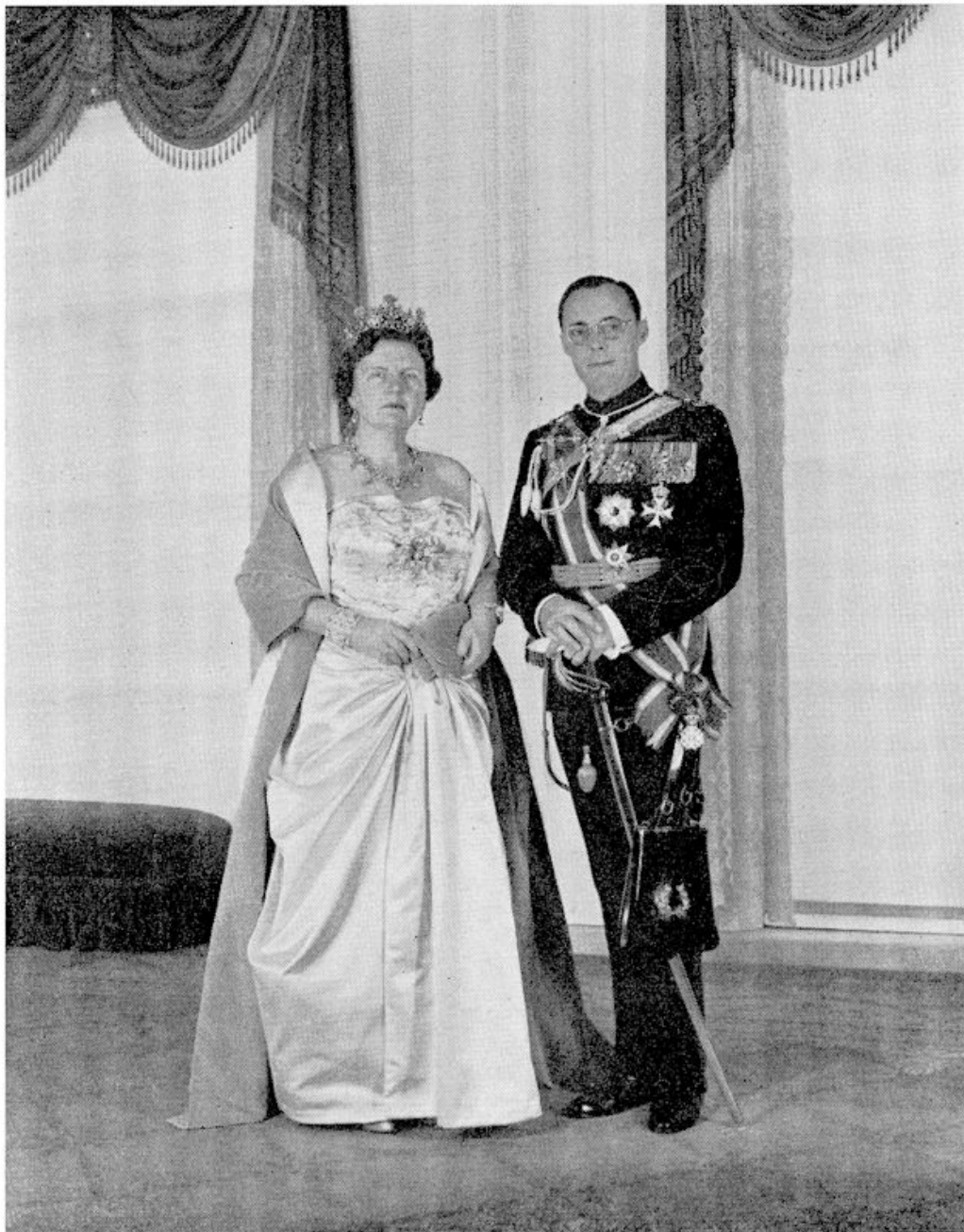
Staatsieportret van het koninklijk paar.