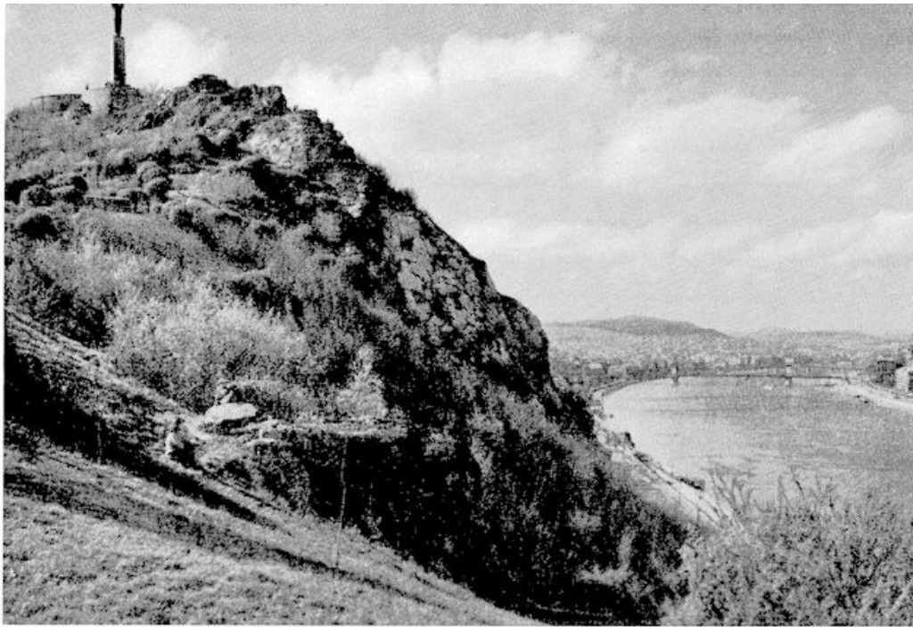
Hoog boven Boedapest op de Gellértberg staat het vrijheidsbeeld dat herinnert aan de Russische overwinning in 1945.

komen was, schreef Reformatus Egyház (Gereformeerde Kerk) het officiële kerkelijke orgaan, in zijn nummer van 15 februari het volgende: „Wij begroeten het socialisme en beschouwen daarmee ook zijn gekollektiveerde landbouw als een gelegenheid die de Heer onze generatie biedt, opdat onze materiële en morele vooruitgang bevordert zal worden. Altijd als wij de bedoelingen van onze Heer in deze wereld gehoorzaam nastreven, is de uitwerking daarvan op het leven van de gemeente vruchtbaar en verrijkend”.