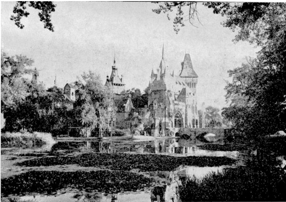
Het Vadjahunyad-kasteel te Boedapest; momenteel ingericht als landbouwmuseum.