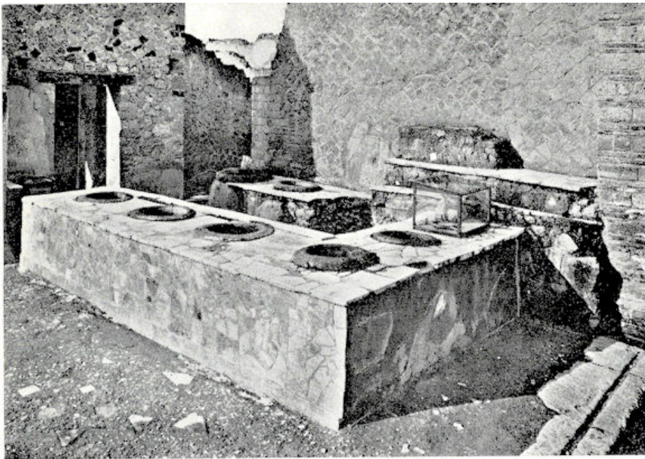
Winkeluitstallingen namen voor een groot deel de trottoirs in beslag in Herculaneum.

gehad. Daardoor is het houtwerk van de huizen intact gebleven. De nagenoeg ondoordringbare laag aarde heeft dit hout tegen bederf bewaard. En zo levert de bodem van deze stad thans de merkwaardigste voorbeelden van de bouw- en meubileringskunst in het Italië van het begin onze jaartelling. De eerste opgravingen hebben min of meer toevallig plaats gehad. Bij het graven van een put in 1709 stuitte men op een muur van het theater van Herculaneum. Men dolf verschillende beelden en andere kostbare kunstwerken op en deze werden over de musea van geheel