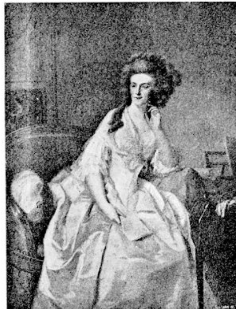
Prinses Wilhelmina (1751-1820). Schilderij van 1789 door J. F. A. Tischbein (1750-1812) in het Mauritshuis te 's Gravenhage.

Niet zonder moeite verkreeg de Prinses van haar echtgenoot toestemming om zich naar Den Haag te begeven. In de vroege