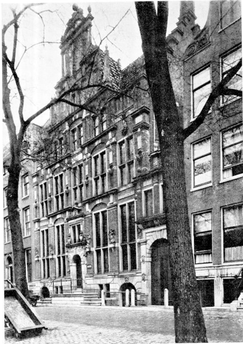
Het beroemde „Huis met de Hoofden”, Keizersgracht 123, Amsterdam

Er woonde lang geleden een rijke koopman met zijn vrouw en een dove dienstbode in dit huis. Op zekere dag waren meneer en mevrouw uit en de dienstbode was alleen in het grote huis. Hoe het kwam wist de dienstbode niet, maar ze was erg onrustig; ze liep van de ene kamer in de andere. Ze vond het niet prettig zo alleen thuis en toen ze in de tuin-kamer kwam, zag ze tot haar grote schrik, dat er een punt van een zaag door een paneel van de deur stak... Toen die zaag heen en weer ging, begon ze niet te gillen, maar ze greep een bijl. ging naast de deur staan en wachtte af. Daar werd de zaag teruggetrokken, het stuk uitge-zaagd paneel verwijderd en toen kwam het hoofd van een inbreker te voorschijn! Met één slag sloeg de dove (doch sterke) dienstbode de man het hoofd af, trok hem naar binnen en wachtte opnieuw af. Zijn collega, nummer twee, volgde en onderging het-zelfde verschrikkelijke lot. Zo ook nummer drie, vier, vijf en zes. Toen kwam er niemand meer. Om-dat de moedige dienstbode niet elke dag zulke kar-weitjes verrichtte, viel ze van emotie flauw. Zo vonden de koopman en zijn vrouw hun huisbewaar-ster terug, temidden van de zes onthoofde lichamen. Een beetje vlogzout deed wonderen en spoedig was de dienstbode weer op de been. De gedode in-brekers werden door de Schout en zijn rakkers weg-gehaald en ter herinnering aan de moed van het dienstmeisje liet de koopman zes mannenhoofden in de gevel houwen en boven op het dak de zevende