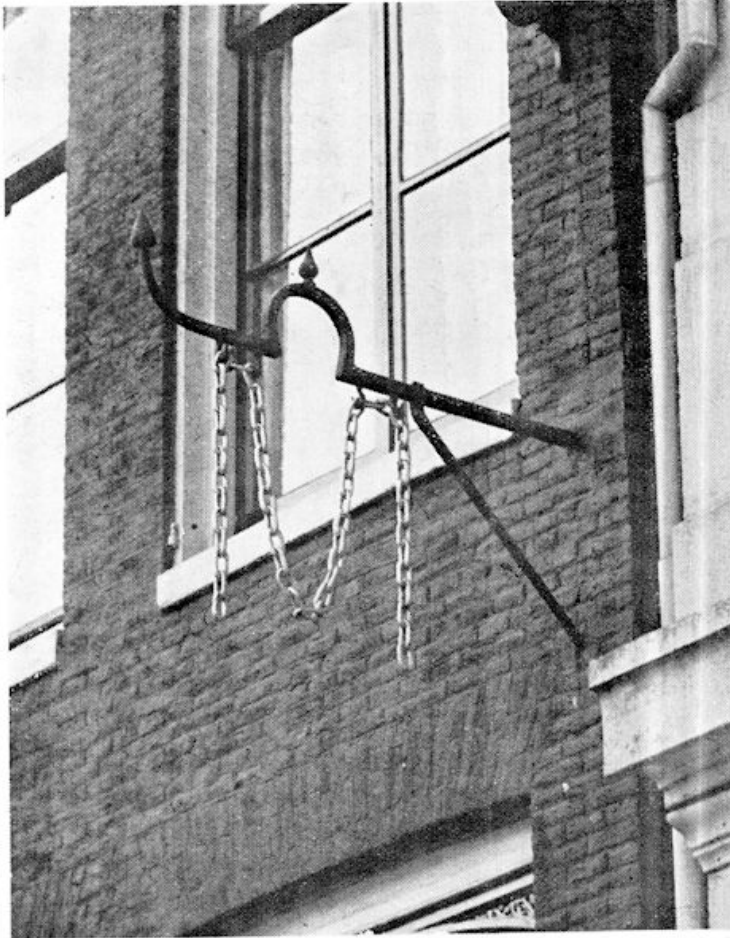
Keizersgracht 268: „Het huis met de gouden ketting”

Dapperstraat-Mauritskade, van Prins Maurits) zult u alleen in Amsterdam aantreffen.