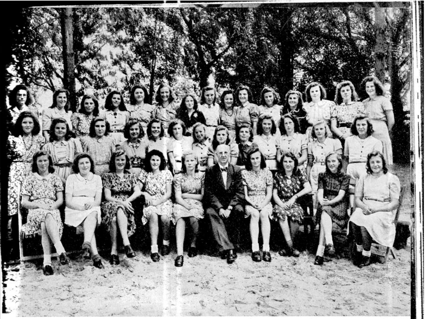
Neerbosch' meisjeszangkoor 1947