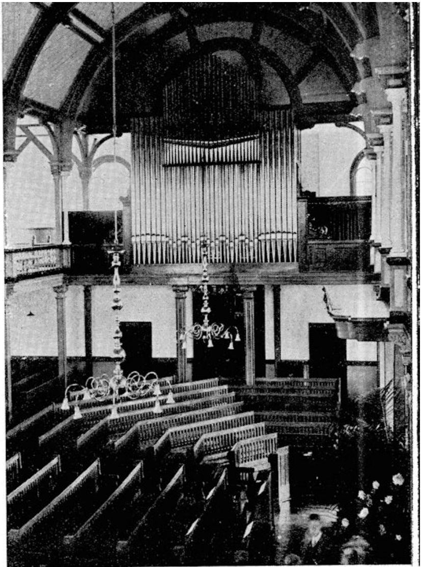
Interieur Wezenkapel met gezicht op het orgel.

Daartoe vond hij gelegenheid in een groot, oud huis, dat hij als Evangelist te Nijmegen in de Lange Brouwerstraat betrokken had.