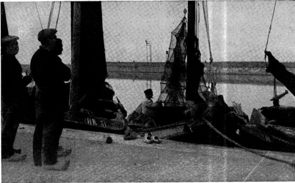
De fuik wordt gerepareerd