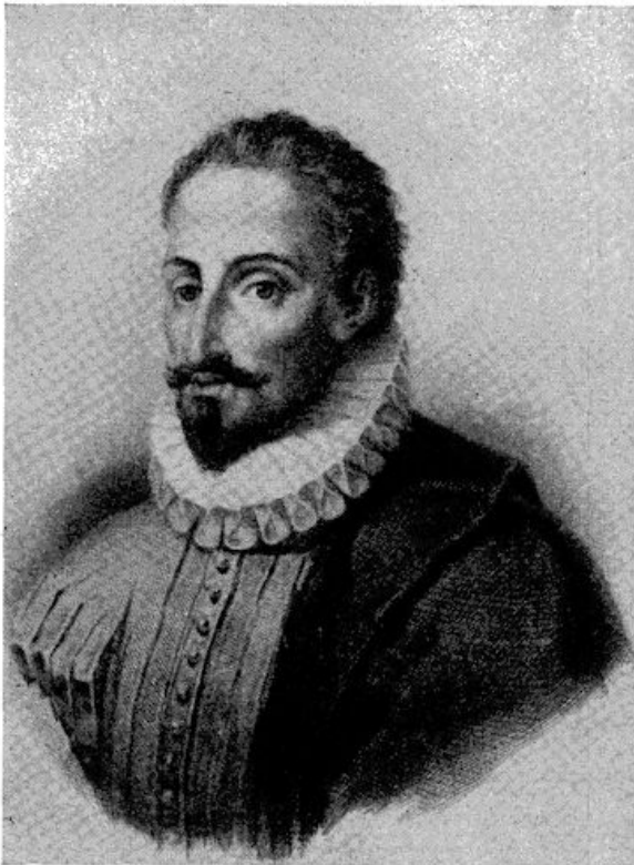
Miguel de Cervantes Saavedra, de schrijver van Don Quichotte.

Cervantes maakte al heel jong verzen hoewel hij later bekende „dat de hemel hem de gave der poëzie niet geschonken had”. Hij was dol op toneel, al was het in zijn dagen nog bijzonder primitief. Hij beschreef dit zelf in het voorbericht van zijn bundel „Comedies en Kluchten”, die een jaar voor zijn dood werd uitgegeven.