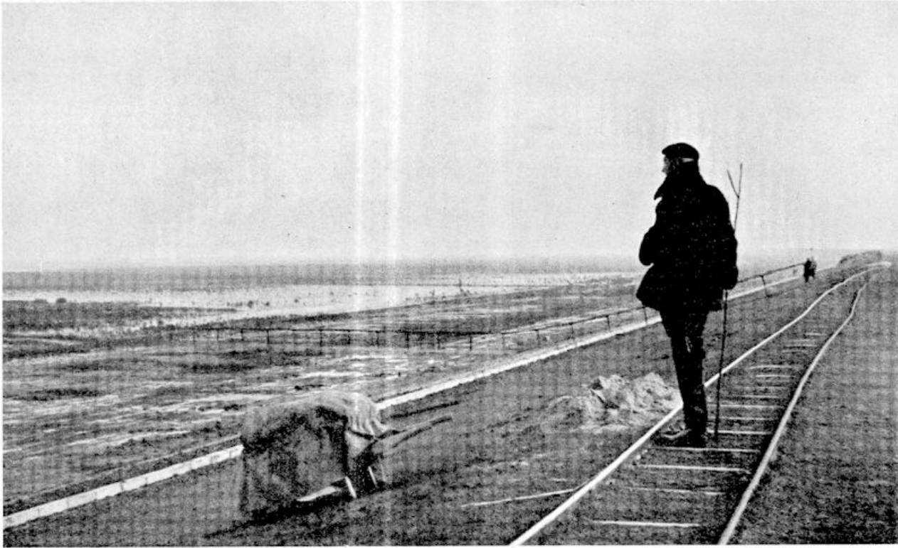
Landaanwinning in Noord-Groningen. Overzicht van de dijk over de slikgronden.