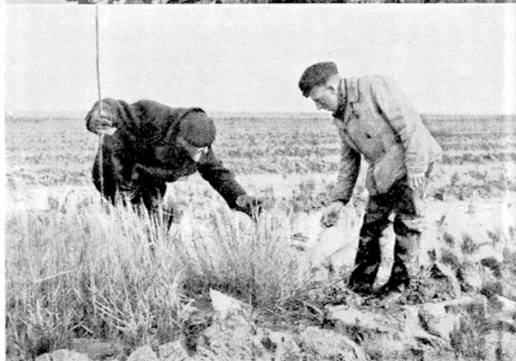
Boven: „Greppelen” in het slib