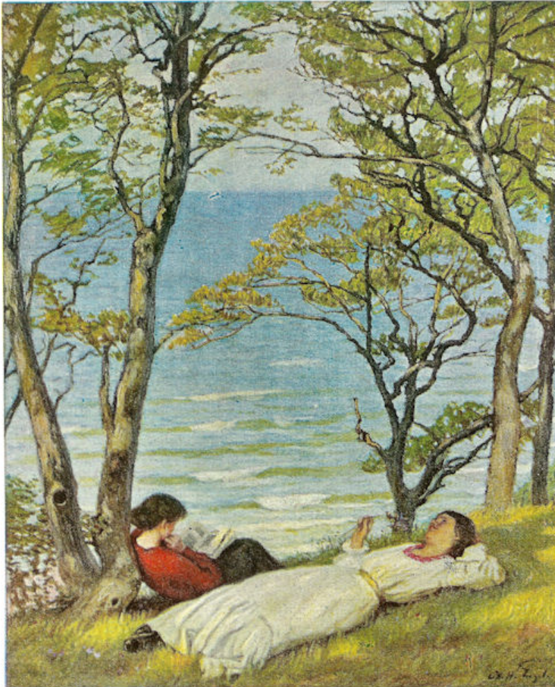
AAN DE OOSTZEE

Waren de Hongaarsche zegels dus getuige van veel leed en onrecht, ze deelen ook in revisie en herstel!