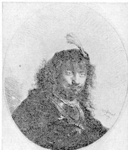
Zelfportret van Rembrandt (1654)