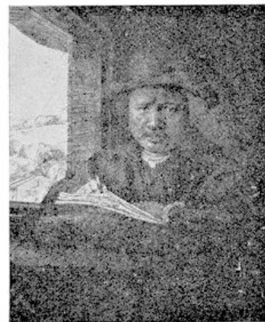
Zelfportret van Rembrandt bij het raam (1648)

In hetzelfde jaar, waarin Saskia hem voorgoed verlaten heeft, voleindigde Rembrandt zijn grootste en thans meest beroemde werk: „Het Korpo-