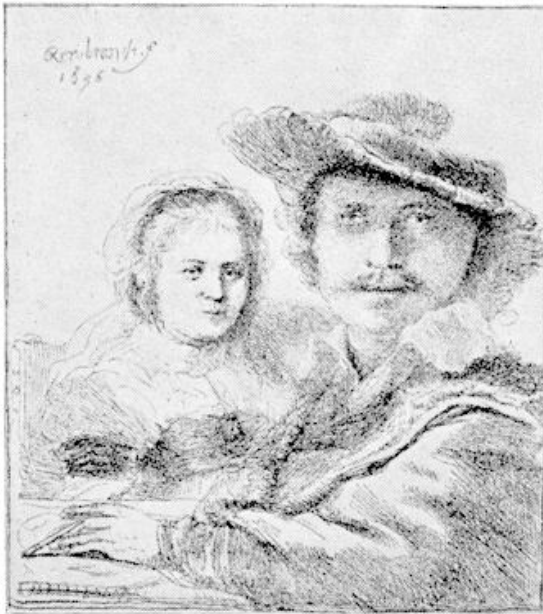
Rembrandt en Saskia (1636)

naar krachtige expressie, en zocht en vond steeds een kenmerkende zielstoestand, een stuwende gedachte, welke aan het gelaat eigen leven schonk.