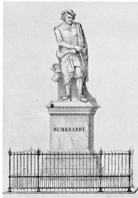
Standbeeld van Rembrandt te Amsterdam

Hij had zich n.l. toegelegd op het schilderen van portretten. Hij had zich daarin ontzettend veel geoefend. Voor een spiegel gezeten schilderde hij vele malen zijn eigen kop, begluurde de uitdrukking der gemoedsstemmingen op de verschillende delen van het gelaat en speelde in het geslepen kristal comedie tegen zichzelf, leek uitgelaten vrolijk, toornig, bedroefd, naar een gril van het ogenblik dit meebracht, leerde aldus het immateriële schilderen en schonk ziel en leven aan zijn getekende poppen. Rembrandt zelf was dus Rembrandt's meest begunstigde model, hoewel er ook reeds in zijn jonge Leidse tijd velen waren, die voor hem „zaten". Zijn gehele familie moest beurtelings aan deze penitentie geloven, vooral later zijn vrouw Saskia. Wat hem onderscheidde van alle portretschilders voor hem, was de beweging, de ziels-dramatiek, welke hij in zijn koppen wist te brengen. Hij schilderde geen placide, strenge gelaatstrekken in rust van uitdrukking, maar streefde integendeel naar bewogenheid van het gelaat,