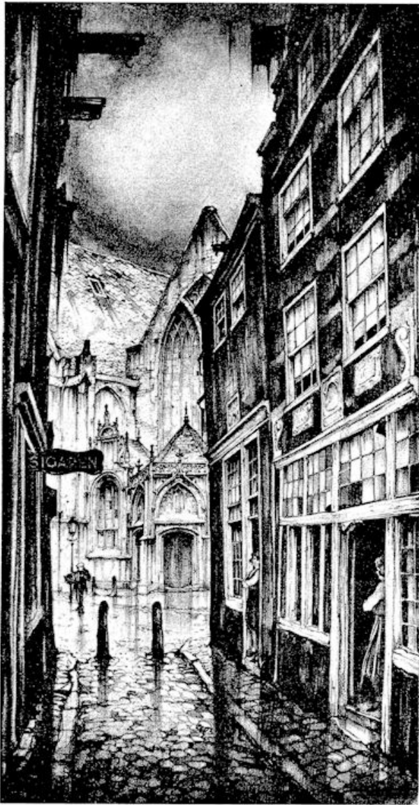
Straatje bij de Oude Kerk te Amsterdam Foto van J. Oppenheim naar een schilderij van Anton Pieck

1911 tot 1930 ongeveer 120 heeft gemaakt.