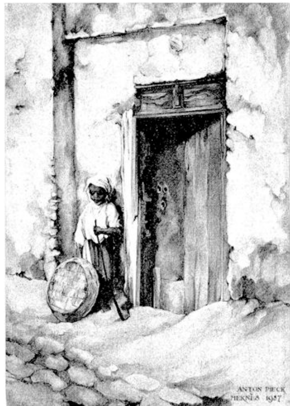
Marokkaanse jongen in Meknès. Foto van J. van Dijk naar een schilderij van Anton Pieck.

Hij ziet niet alleen het wonderbaarlijke in den vreemde doch ook in eigen land. Hij ziet de legende en sproke in de sloot en het veld van Holland. Als