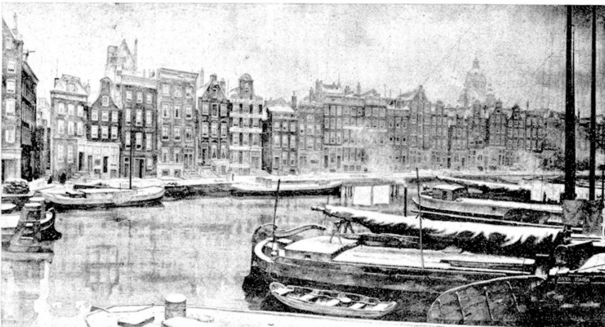
Het Damrak te Amsterdam