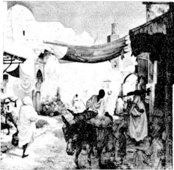
Deze „Straat in Rabat” herinnert aan Pieck’s Marokkaanse reis in 1937.

schenkt en de heerlijkheid van de natuur en de blijde feesten van het jaar wordt dan Pieck door Timmermans geleid.