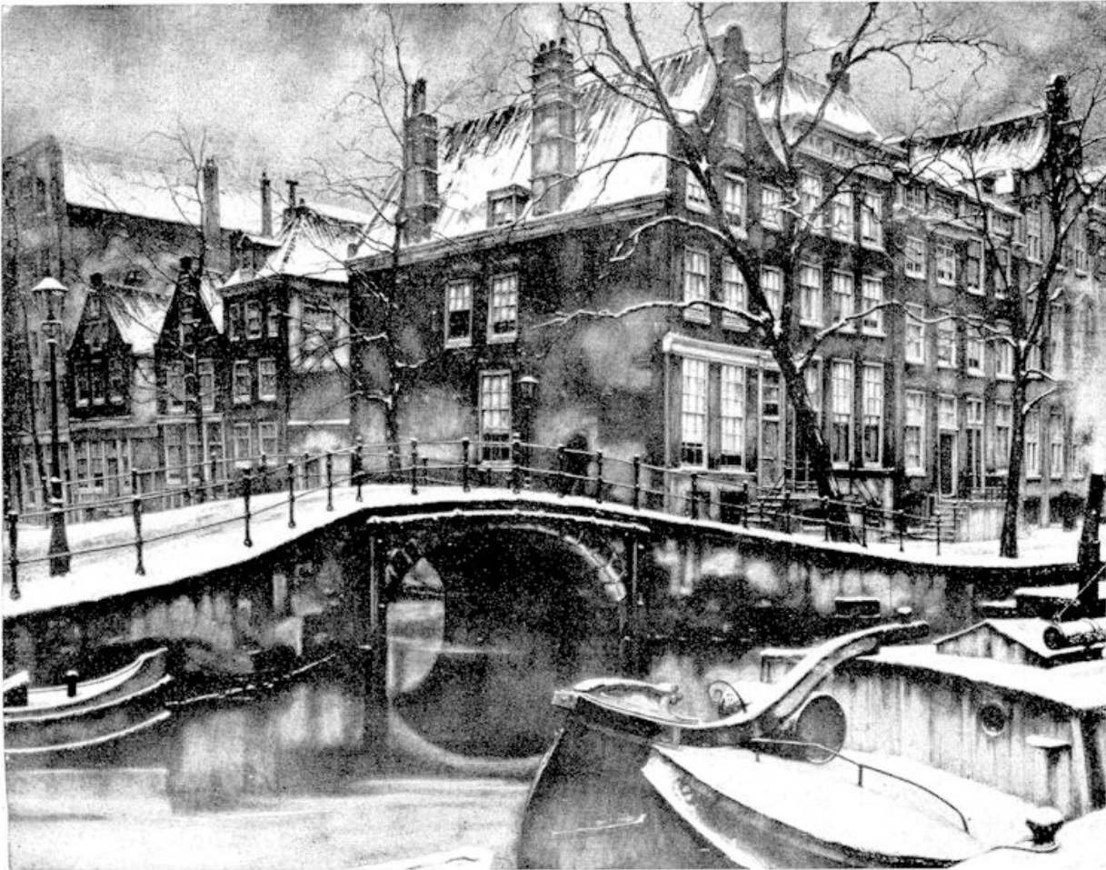
Geboortehuis van het Persbureau Vaz Dias (Reamrecht, heek Greenburgwal) te Amsterdam.  naar een zwartkrijttekening van Anten Pieck

Het is het volk, waarnaar Pieck's hart uitgaat. het innig-menselijke heeft zijn liefde als kunstenaar. Tot dat volk in zijn hartelijk spontaan uitleven en in zijn opgeruimd genieten van wat God den mens