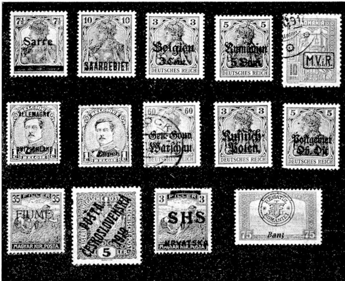
afb. 2. Bezette gebieden, verloren gebieden, nieuwe landen.

af. Na de harde „vrede” van Versailles, die de kiem van deze, thans woedende oorlog in zich droeg, kwam de reactie, die voor vele landen diepe vernederingen met zich bracht.