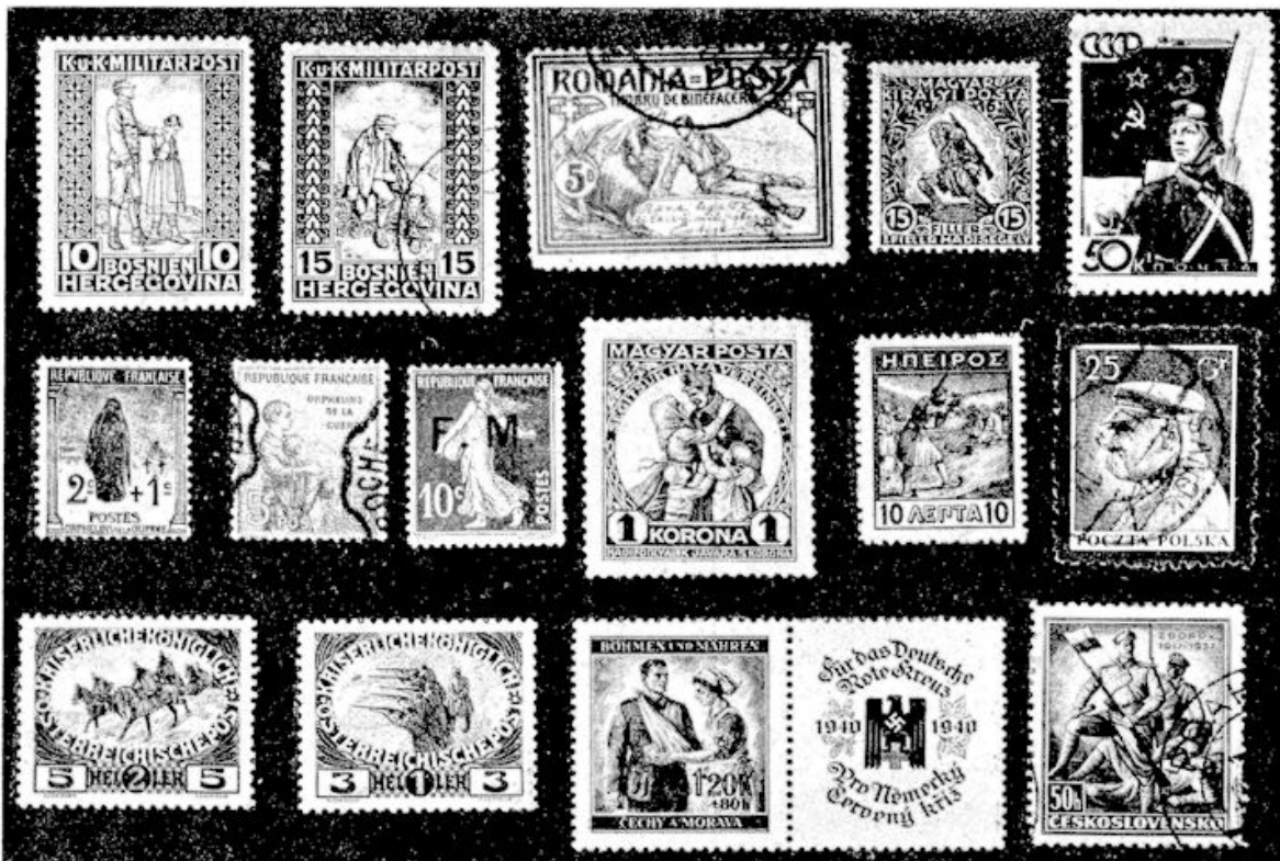
afb. 1. Het oorlogsbedrijf op postzegels, heldhaftigheid, en de droeve eindbalans: invaliden, weduwen en weezen.