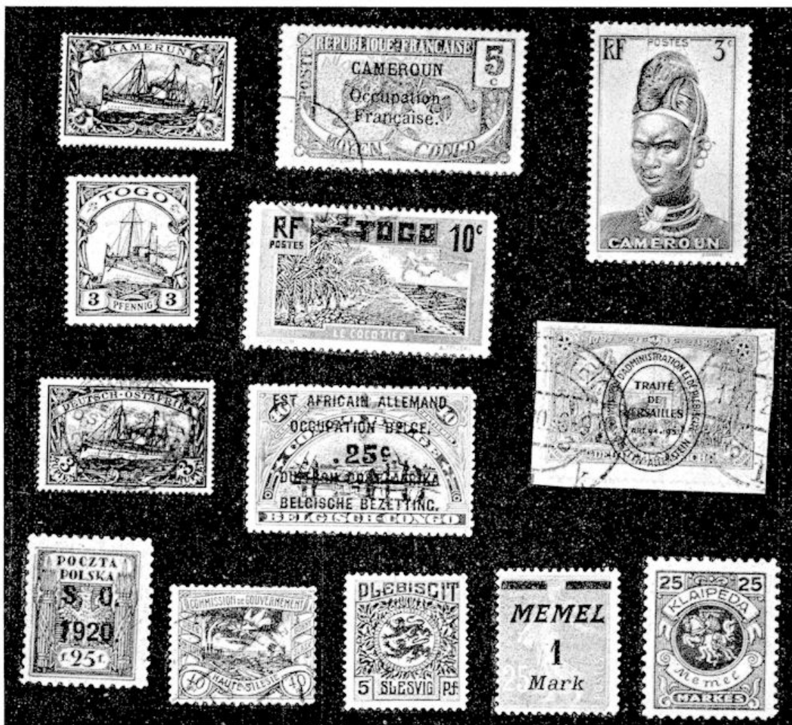
afb. 3. Bezette en verloren koloniën, volkenbondsbestuur, plebiscieten.

Maar bij het gebied in Europa bleef het niet. Ook de Deutsche koloniën gingen over in andere handen. Daarvan geeft afbeelding 3 enkele voorbeelden. Kameroen kwam onder Fransche bezetting. Fransche zegels van Midden-Congo met de opdruk Cameroun occupation française moesten dienst doen, in afwachting van