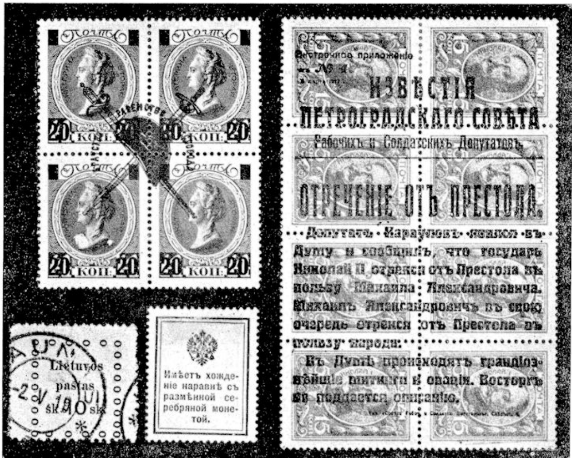
afb. 4. Revolutie opdrukken op Czaren jubileum: postzegel als noodgeld, en het primitieve eerste zegel van Litauen,

Ook de economische en technische moeilijkheden als gevolg van een oorlog vinden hun weerspiegeling op de postzegels. Op afbeelding 4 links onderaan is er allereerst het eerste zegel van het zelf-