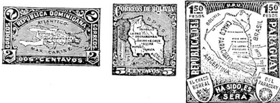
afb. 6. Annexatie neiging van Domin. Rep.: Postzegels als oorlogsaanleiding: Chaco Boliviano, en Chaco Paraguayo

gedaan worden, hetzij door de groepeerling der waarde-cijfers, de opstelling der beginletters der landen op de zegels vermeld, of door volgorde der zegelkleuren al of niet met gebruikmaking bovendien van een code of sleutelwoord.