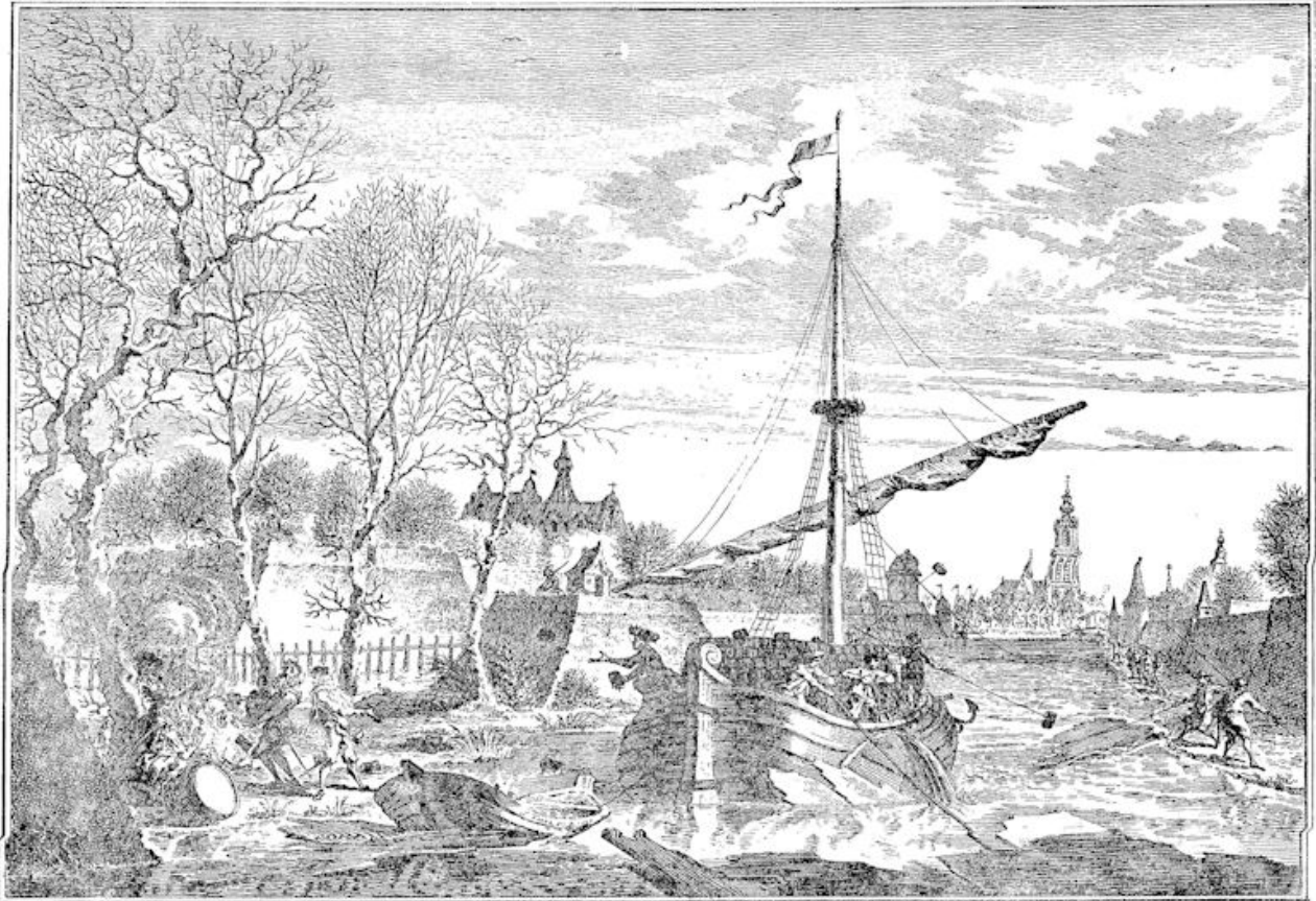
t Kasteel van BREDA verrast, door middel van een Turfschip, int jaar 1590.