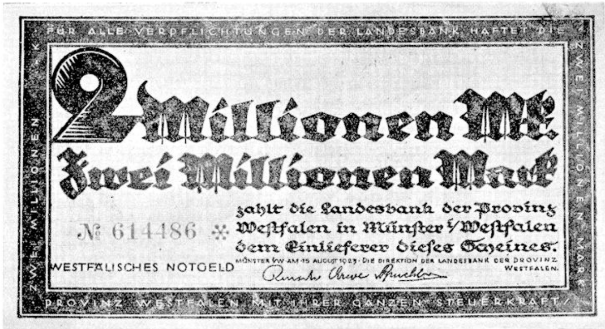
Provincienoodgeld van Westfalen 2 miljoen.