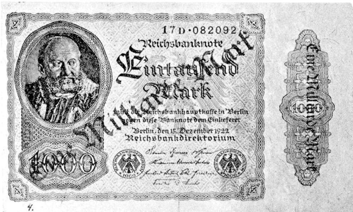
Opdrukken als bij de postzegels. 1 milliard op 1000 mrk.

Daarentegen werd steeds duidelijker, dat vele werkelijk gebruikte — „echt gelopen" — inflatiezegels, wegens hun korte geldigheidsduur, betrekkelijk zeldzaam voorkomen, en eenige kans op waardestijging bieden, vooral wanneer zij normaal met datumstempel afgestempeld, zich nog