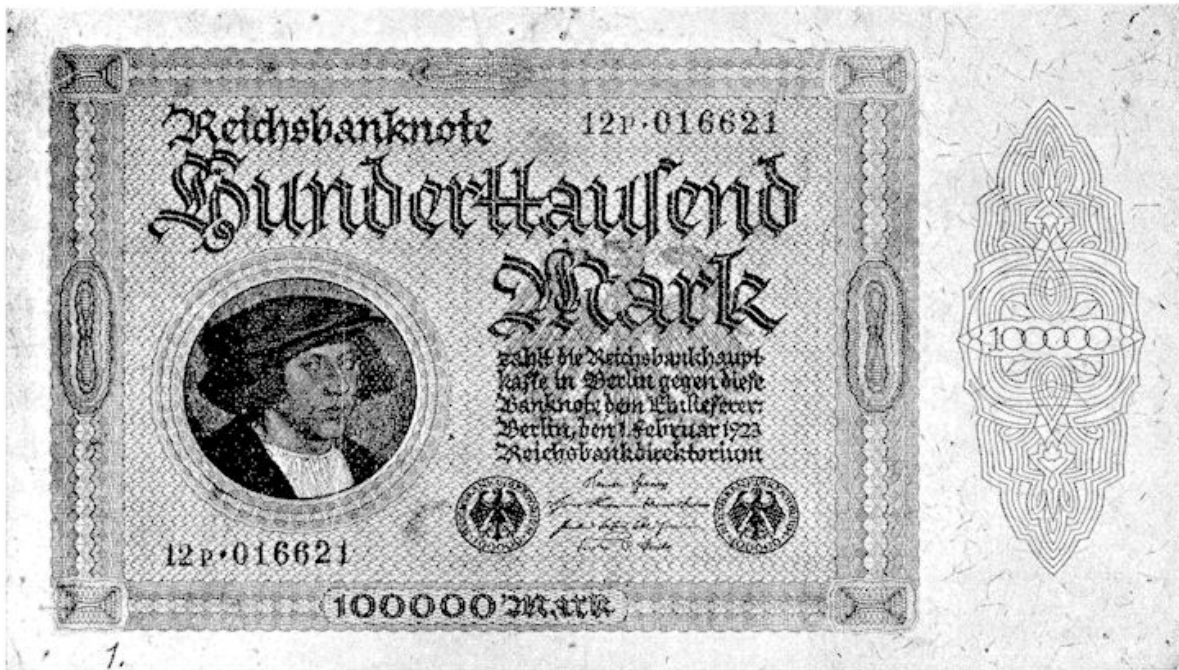
100.000 mark, nog deftig drukwerk!

schrijdende inflatie gunde helaas deze fraaie zegels geen lange geldigheidsduur.