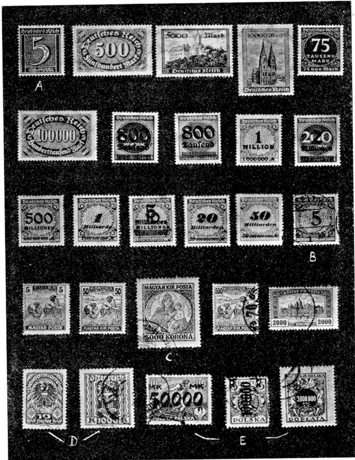
A tot B van 5 pfennig tot 5 Rente pf. Daartusschen is de heele inflatie-lijdensweg. — C Hongarije van 5 filler tot 5000 kronen. — D Oostenrijk van 10 heller tot 1000 kronen. — E Polen 50.000 mrk op 10 mrk, 100.000 op 5 mrk, en 3.000.000 mk.