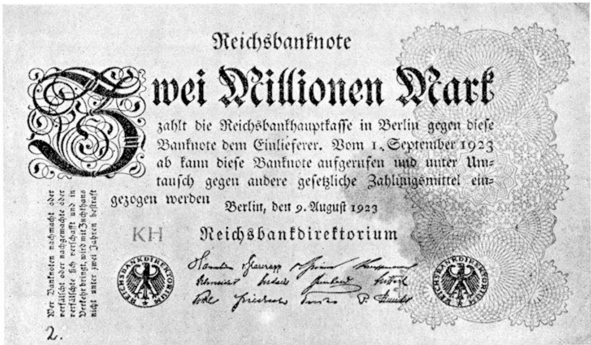
Millicenen vodjes! 2 millioen.

Inplaats van zegels plakte men op de postzendingen strookjes met het opschrift: „gebühr bezahlt Taxe perçue”, en daaronder met inkt ingevuld het betaalde bedrag. Soms ook volstond men met eenvoudig dat bedrag op de plaats van het zegel te stempelen —, met de paraaf van