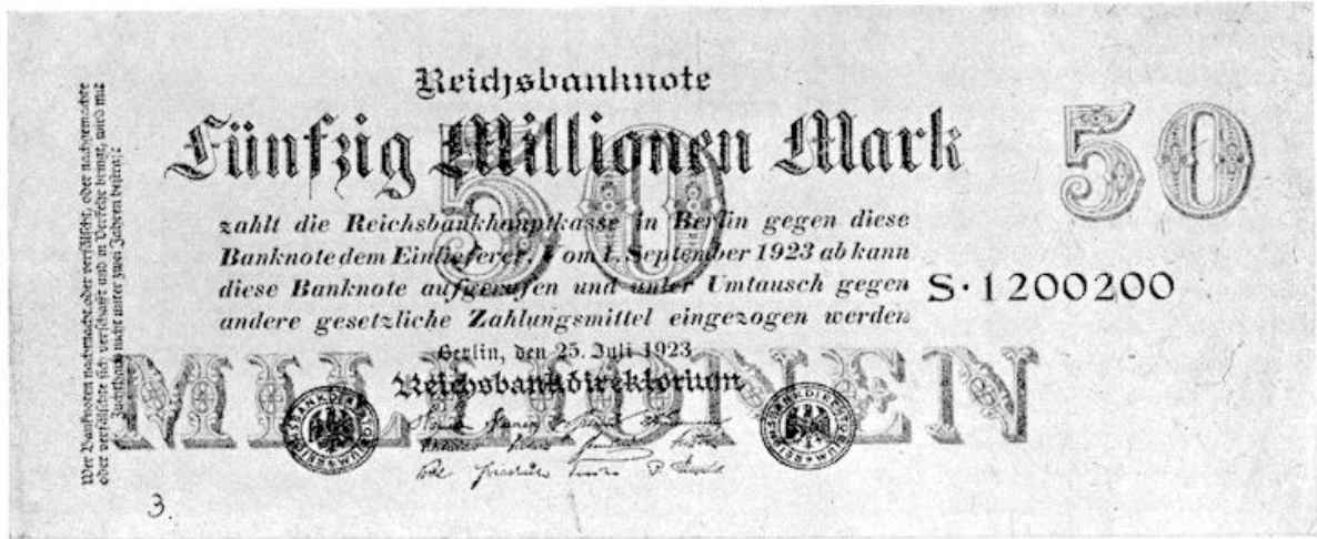
Millicenen vodjes! 50 millioen.

Op 1 December 1923 verschenen de postzegels met eenvoudig de sobere cijfers 3, 5, enz., zonder nadere aanduiding; het spook der inflatie was verjaagd, en het wonder van een stabiele Rentemark was werkelijkheid geworden!