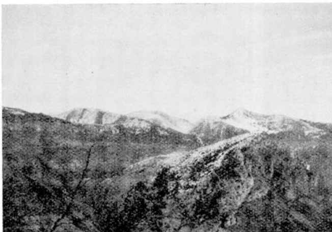
Het besneeuwde achterland der Zee-Alpen

Enkele jaren geleden, brak een kabel en suisde een wagen omlaag. Er waren dooden en gewonden. Maar sindsdien is de dienst stop gezet. De concurrentie met de autobus maakte de moeite van herstel niet loonend meer. Men liet de zaak zooals die was. De Franschen hebben, naast hun vele voortreffelijke eigenschappen, een charmante slordigheid, en gevaarlijke nonchalance,