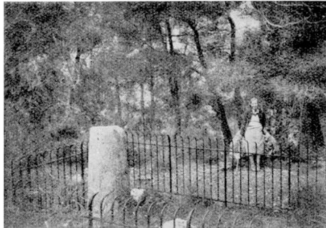
Romeinsche mijlpaal aan de oude heirweg

die meer dan eens oorzaak waren van een catastrofe.