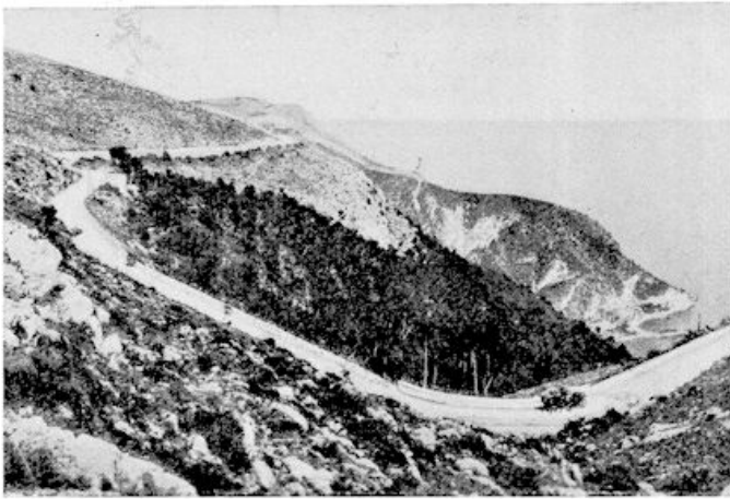
De moderne heirweg La Moyenne Corniche

thans in het prae-historisch museum, even over de Italiaansche grens bij Menton, bewaard worden.