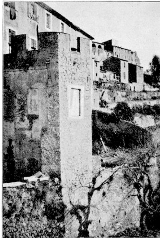
Gorbio. De huizen zijn op en over en tegen elkaar gebouwd.

maar de wilde strijdvaardige natuur van hun oervoorvaderen toch aardig hadden behouden. Het valt tenminste