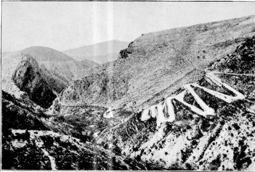
Thans slingeren nuchtere autowegen hun asfaltdek naar boven.

bijten op elkaar, hetgeen wijst op een gebruik van andere voedselgerechten, dan die welke de mensch van onze eeuw pleegt te nuttigen.