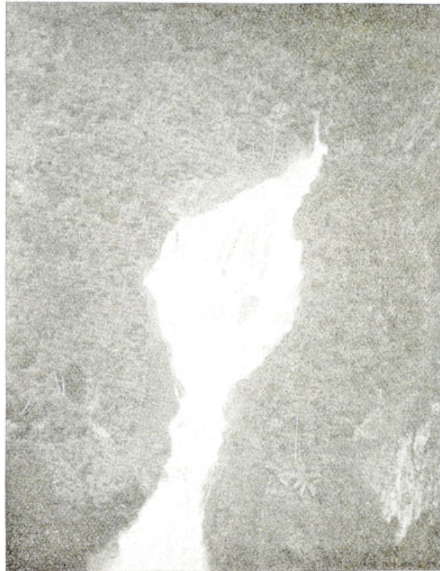
Waternival in het gebergte.

Kort na Siborong-borong vertoont de weg de allerwonderlijkste korte bochten. Aan den rechterkant staat hard en onverbiddelijk de grijze rotsmuur en links dalen de begroeide ravijnwanden honderden meters omlaag. Heel ver beneden bruist en kronkelt de rivier, maar haar bruisen wordt verreweg overstemd door de luidruchtige autosignalen, die men hier onophoudelijk dient te geven voor eigen en anderer veiligheid. Zoo rijden we Pitoe Pintoe tegemoet, het land der zeven Poorten, misschien wel zoo genoemd naar de openingen in den rotswand,