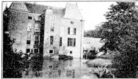
Zij-aanzicht van kasteel Hardenbroek

Men ziet reeds uit de opsomming der referatentitels, welke de samenhang is. Alle drie de lezingen bespreken een verhouding en wel een zeer fundamentele. Noodig is zulk een relatiebepaling stellig, want over de plaats der literatuur in het leven, over haar taak en haar verantwoordelijkheid heerscht nog menig wanbegrip, is nog veel te weinig degelijk nagedacht en heeft men onderling nog niet genoegzaam van gedachten gewisseld. Door de laatste conferentie evenwel zijn de diverse