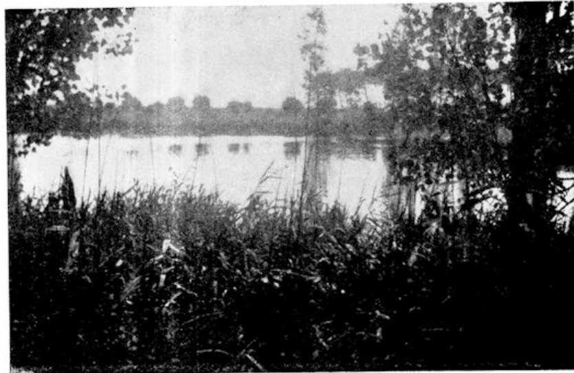
De plas, temidden van riet, en peppels, en wilgen. . . .

Rond zoo'n rietmat loopt het kooi- hondje — al maar om dezelfde mat. Dat bewegende spel lokt de eenden, hun nieuwsgierigheid trekt hen de pijp in . . . . En dan zien ze in de verte het licht . . . . Vóórin de pijp is het donker en schaduwrijk, door het loof van de overwelfende boomen — achter daalt het daglicht ongehinderd tot op den glanzenden waterspiegel: het lok- kende licht . . . .