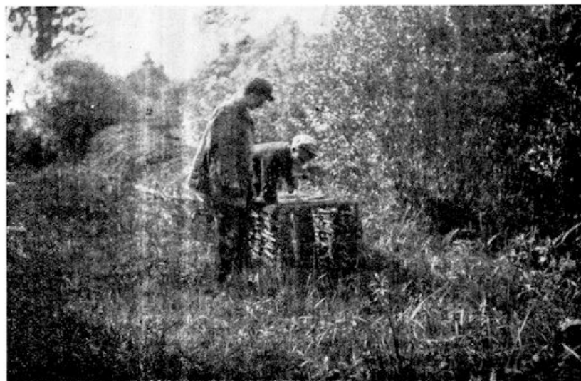
Het einde van de pijp. Gerrit grijpt naar een eend in het hokje. De opgetrokken klep, die den terugkeer onmogelijk maakt, is te zien.

Teruglopend naar het huisje om schuiling te zoeken, legde Gerrit ons uit, wat daarvan de bedoeling is. Vanaf de plas zwemmen de eenden de smalle slooten in, die in de pijpen eindigen. Långs die pijpen staan rietmatten, gezdurig echter een kleine opening latend.