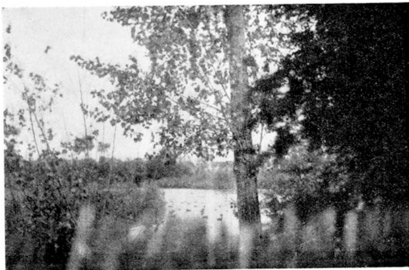
Middenin lag de plas — Het wemelde er van eenden. . .

O, dat lijkt een onschuldige loop- plank, die uit het water op den kant voert, maar er zit een lange lijn aan, die loopt naar het plekje waar de