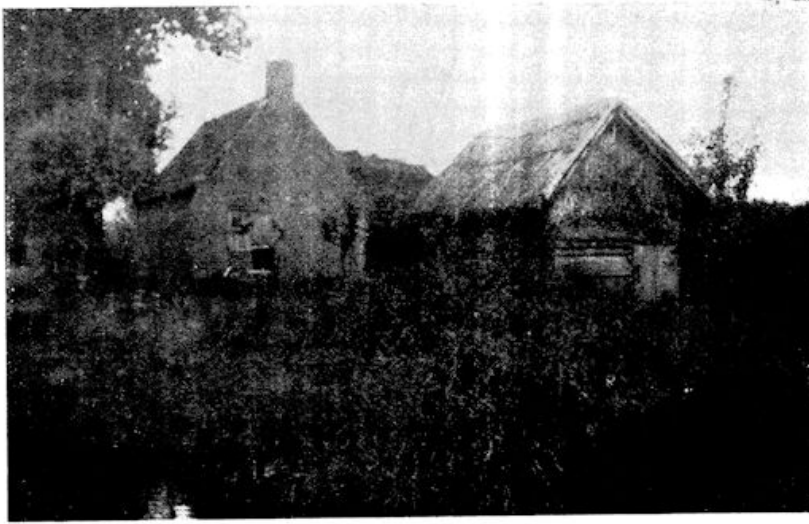
Kooikershut en schuurtje

D e jonge dominee had me beloofd: „Als je es een paar dagen op ons dorpje komt, zal ik je de eendenkooi laten zien. Da's geweldig interessant.”