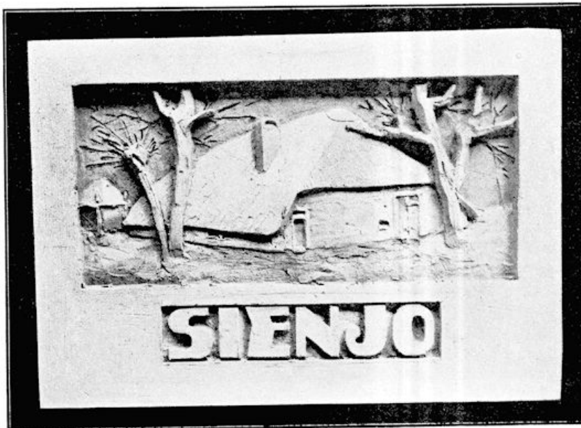
GEVELSTEEN IN WOONHUIS

Maar om op de gedachte terug te komen, die in het beeld belichaamd werd: onderaan de groote blokken, dat is de eerste ordeschepping uit de chaos. Daaruit voeren splitsingen omhoog naar een méér-gevorderde staat van zaken. In de hoeken ziet men reeds mensche- figuren, doch in elkaar gedoken, — niet vrij nog. Hooger-op voeren steeds meere splitsingen, als orgelpijpen, naar een toestand van steeds grootere vrijheid. En als het ware uit hen wijst de Waarheid, met een gebaar van openheid.