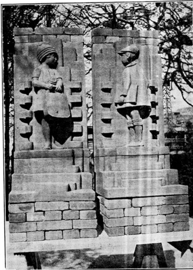
Details van een schoolgebouw in de Wippolder te Delft.