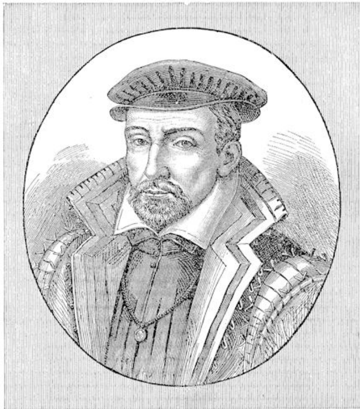
Portret van DE COLIGNY.

In den namiddag kwamen de Koning en de Koningin-Moeder, Katharina de Medicis, den admiraal bezoeken en stelden daardoor de beangstigde Protestanten, die zich reeds tot een overhaast vertrek gereed maakten, gerust. Bij dit bezoek had de Koning een onderhoud met De Coligny, waarbij niemand, ook niet de koningin-moeder, mocht tegenwoordig zijn. Toen deze later er bij haar zoon op aandrong, te weten wat er tusschen hen was verhandeld, vernam