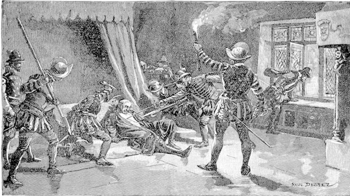
Dood van den Admiraal van Frankrijk.

Dat het hoofd van De Coligny van het lichaam werd gescheiden en naar Katharina de Medicis gebracht, wordt door Roomsche schrijvers voor een ver-