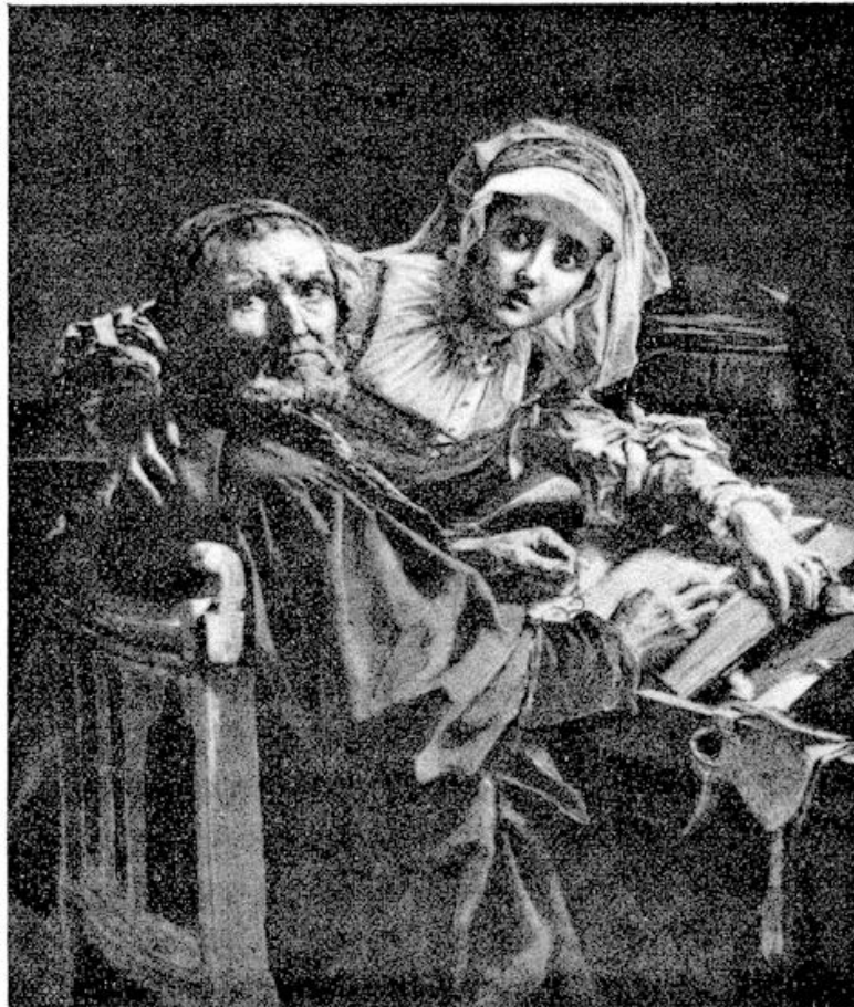
VERBODEN LECTUUR. (Uit den tijd der Hugenoten.)