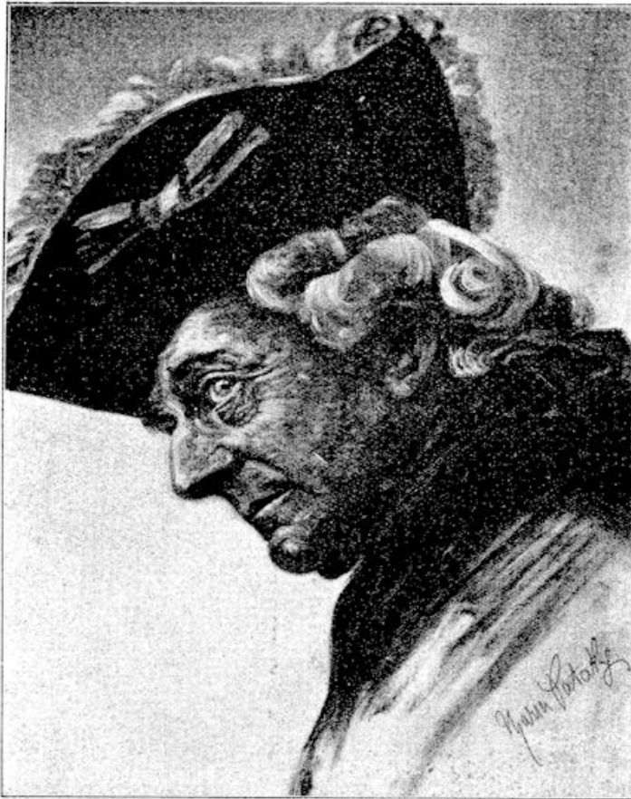
FREDERIK DE GROOTE 1712—1786.

man van aanzienlijken rang, en vond dat alles buitengewoon prettig, totdat hij, wat ouder geworden, door een zijner leermeesters in kennis werd gebracht met de werken van de toenmalige Fransche schrijvers, die hem zoo aantrokken, dat hij alle overige dingen er voor verwaarloosde en den toorn opwekte van zijn vader, den strengen, hardvochtigen Koning Frederik Wilhelm I, den man van het regiment reuzengrenadiers.