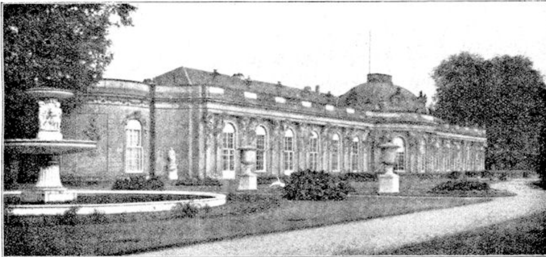
Het lustslot Sanssouci, in welks park nog altijd de molen staat, wiens eigenaar bekendheid kreeg door zijn onwil om zijn eigendom aan den koning te verkoopen.