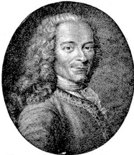
FRANÇOIS MARIE AROUET DE VOLTAIRE 1694—1778.

nuchterd, als hij den Franschman hoorde uitvaren tegen ieder, die zich verstoutte met den Koning te spreken of den boosaardigen laster vernam, waarmee Voltaire verschillende personen uit 's Konings omgeving belasterde, ten einde hen te verdringen. Hoe menigmaal bedierf Voltaire de goede stemming in het gezelschap door den giftigen nijd, waarmee hij anderen tot zwijgen bracht.