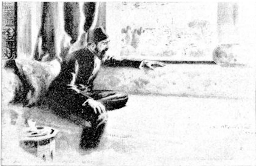
Abdul-Hamid voor het venster van zijn paleis.

Op het oogenblik is de Sultan van Turkije 66 jaar oud. Hij is van middelmatige grootte en moet buitengewoon mager zijn. Een korte baard bedekt zijn ingevallen wangen en de zwarte