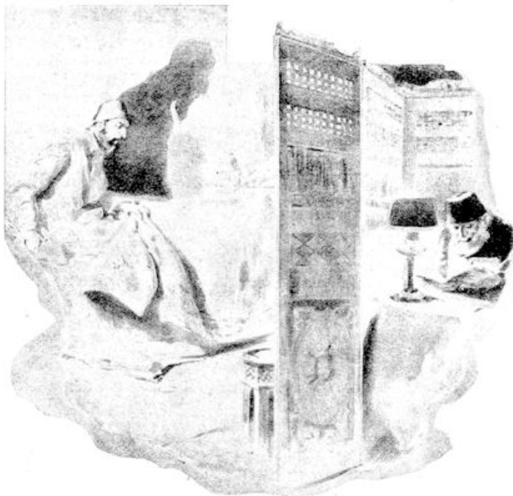
Abdul-Hamid in zijn slaapvertrek.

uiterste hoeken verlicht en een muziekkorps moet gedurende lange uren de stilte verdrijven. Eindelijk, nadat hij zich heeft overtuigd dat alles in orde is en hij zelf de deuren van zijn vertrekken, waarvan hij de sleutels bij