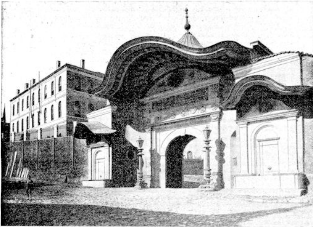
De Verheven Porte; de zetel der Turksche Regeering.