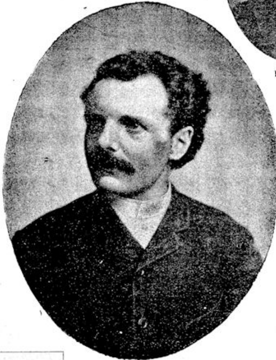
J. J. GOES. †

dankbaar gestemd want onze abonné's laten hunne namen over het algemeen zeer vast staan op de lijsten; zij spreken menig goed woord voor ons, hetgeen be-merkt