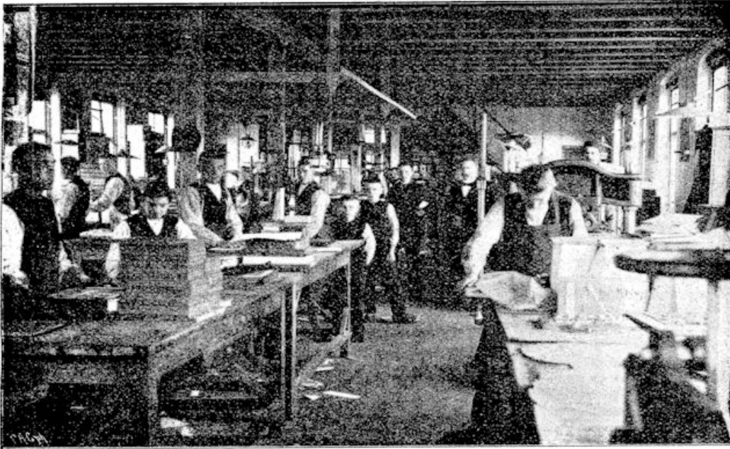
Boekbinderij der Weesinrichting.

de Vriend allerwegen degelijke en christelijke lectuur aan ouderdom en jeugd, bracht hij onzen jongen typografen een veelzijdige gelegenheid om zich te bekwamen in hun vak, het is zeker niet te berekenen hoe velen door dezen Vriend erg hebben gekregen in de Weesinrichting te Neerbosch en haar gingen opnemen in het gedurig gebed en de geregelde verzorging.