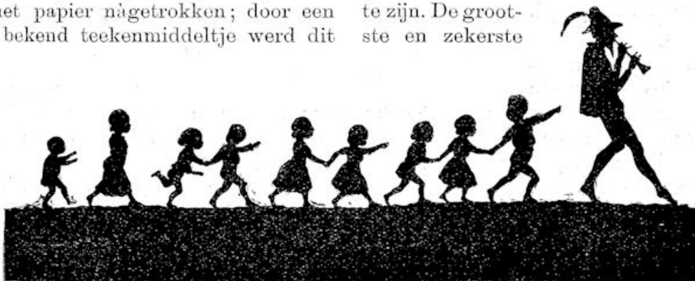
De rattenvanger van Hameln.

't Was en bleef een wel aardige liefhebberij. En kon je 't niet, nu daarom was 't nog wel mogelijk een goed kunstenaar te zijn. De grootste en zekerste