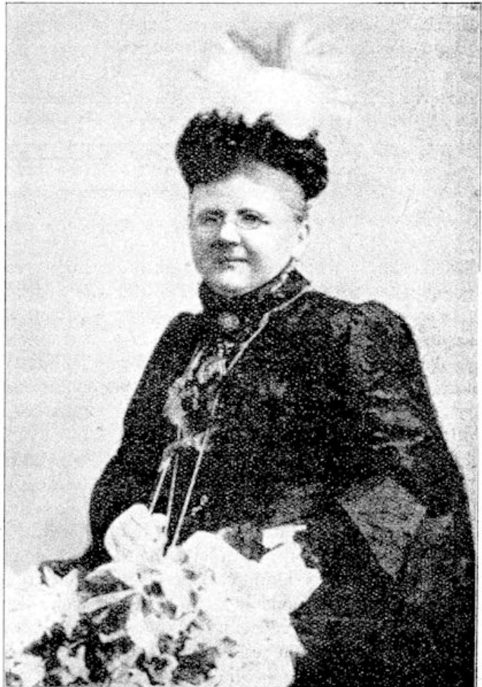
H. M. Koningin EMMA.

viel het ten deel aan Johan Willem Friso en vervolgens aan de Stadhouders Willem IV en Willem V, totdat het in 1795 gevoegd werd bij de