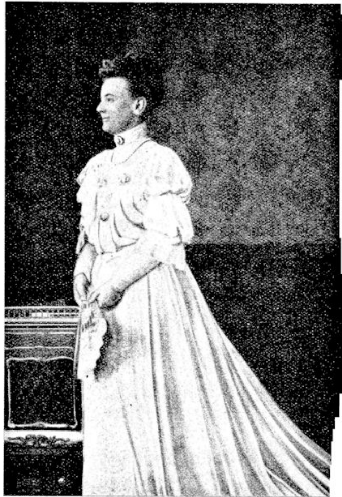
H. M. Koningin WILHELMINA.

Bij een van hare laatste portretten, voegen we de afbeelding van het Koninklijk Paleis te 's Gravenhage. Moeten we veel woorden gebruiken om uiting te geven aan onze gehechtheid en trouw aan de vorstin van God ons gegeven, aan onze liefde voor Koningin Wilhelmina, die velen onzer hebben zien opgroeien en van wie we weten hoe vroom en hoe vroolijk, hoe verstandig en practisch, hoe mild en meelijdend,