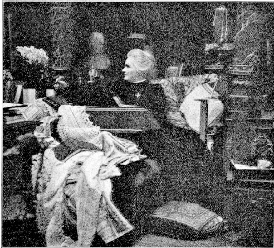
Koningin Elisabeth van Rumenië.

Ik geloof dat wij elkaar reeds eerder hebben ontmoet. Jaren later in 1869, werd te Neuwied de kennismaking hernieuwd, in October van dat jaar verloving gevierd van Vorst Karel van Rumenië en Prinses Elisabeth Pauline Louise von Wied, en een maand later het huwelijk gesloten.