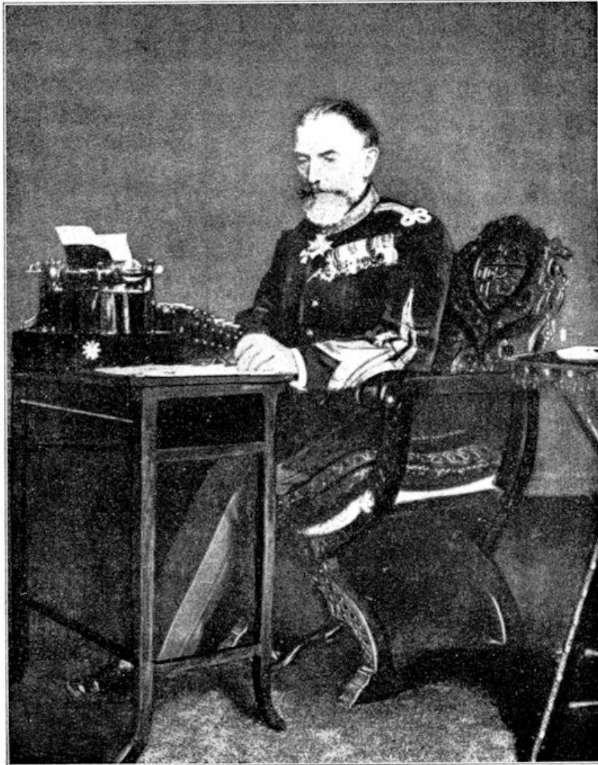
KONING KAREL VAN RUMENIË AAN DE SCHRIJFMACHINE.