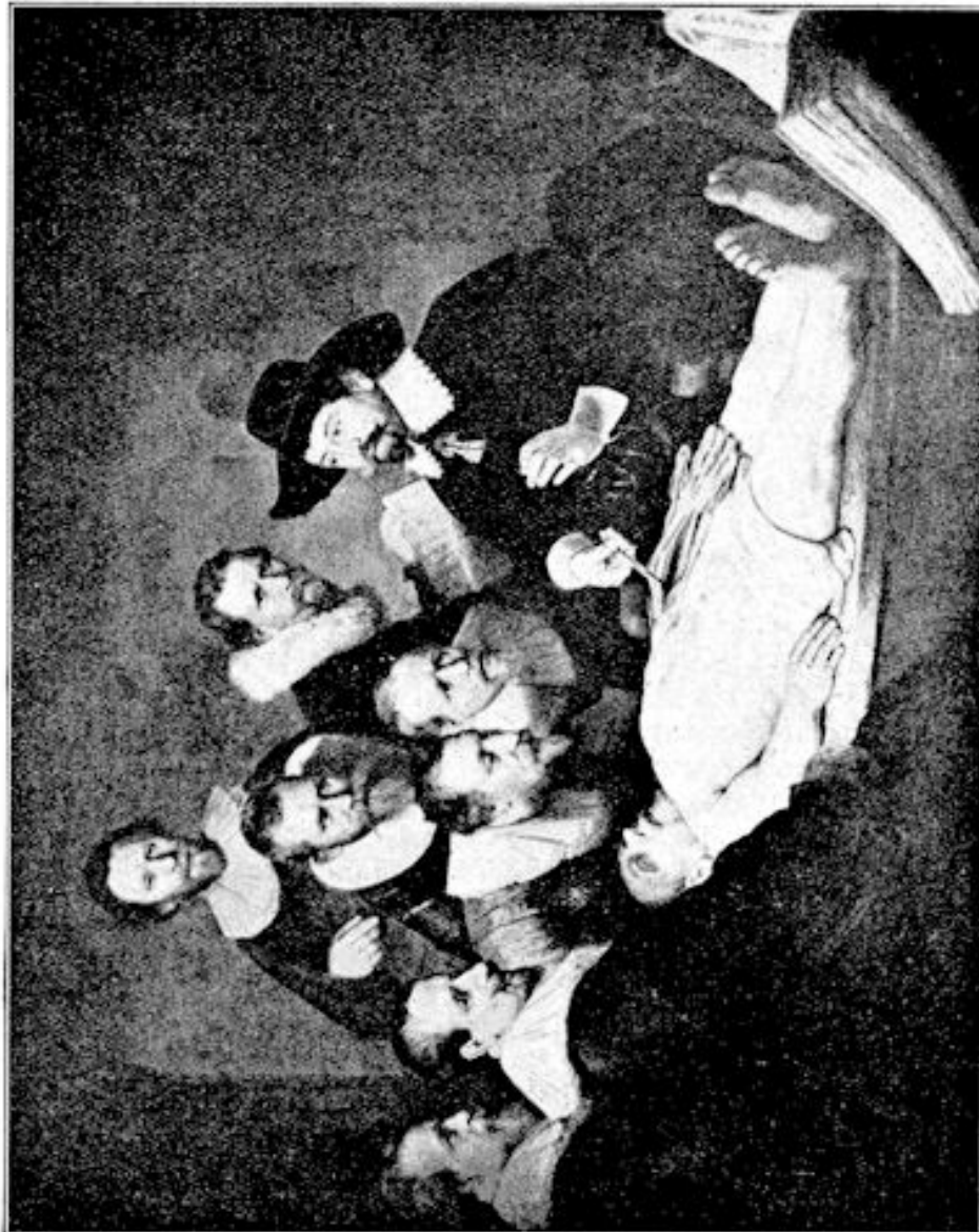
DE ANATOMISCHE LES.

bleven. Schande over onze voorvaderen dat we moeten lezen hoe na zijn dood in zijn woning niets werd gevonden