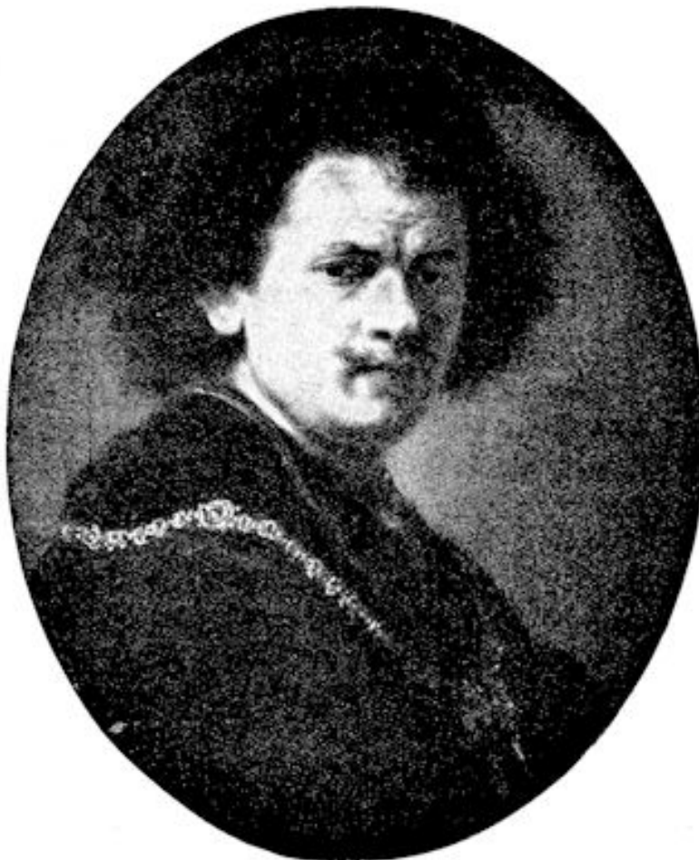
Rembrandt op 27jarigen leeftijd.

waaronder hij zijn laatste levensjaren sleet, een schrille tegenstelling vormde met het feit dat zijn kunstwerken (