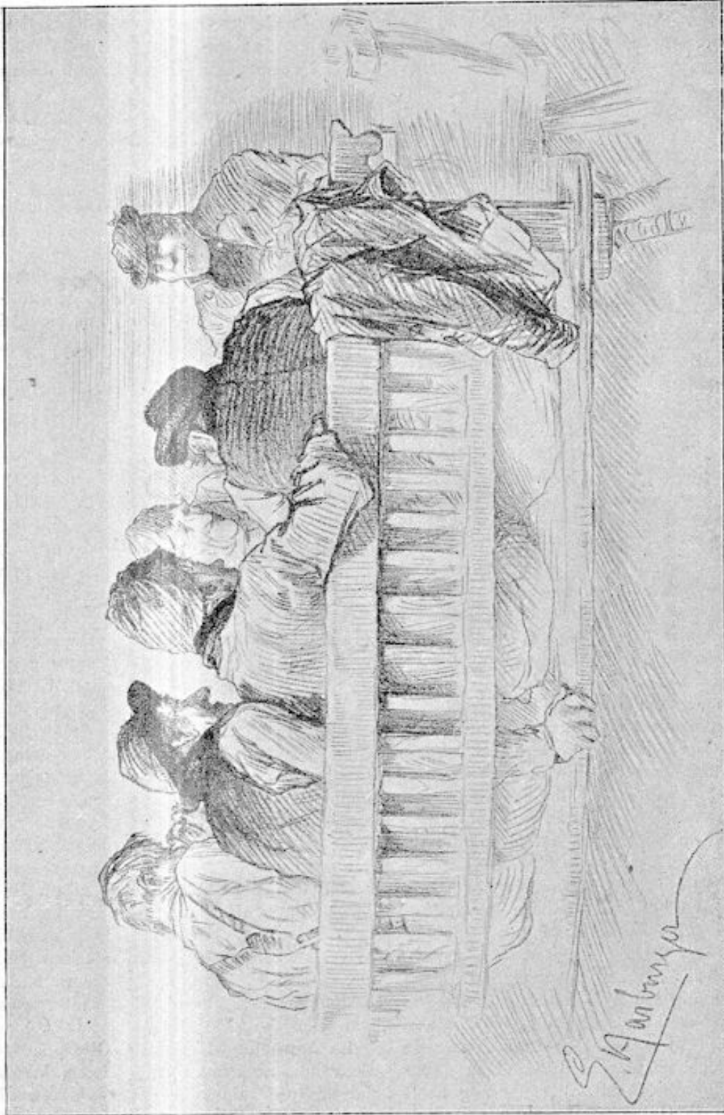
EEN GEWICHTIGE CONFERENCE.