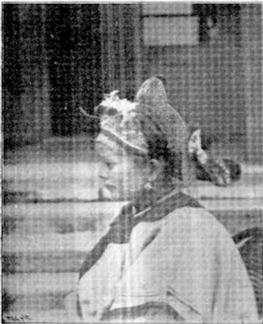
VERPLEGSTER VAN SIO-KE.

Het was hem echter gebleken bij den arbeid in het Neerbosch' hospitaal, dat het van groote beteekenis zou zijn, wanneer ook voor vrouwen een dergelijke inrichting werd geopend. Daar de afstand tusschen mannen en vrouwen zoo groot is, is het onmogelijk om personen van beide geslachten in één huis op te nemen. Dit deed hem voor God op de knieën vallen en bidden om raad en uit-