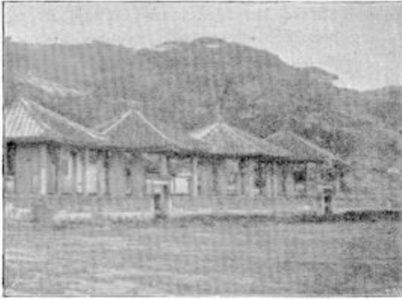
TEMPEL TE SAM-PO-TO.

soms hadden zij 20 uren ver geloopen, of waren over rotsen en bergen kruipende uit het binnenland gekomen. Het hospitaal was steeds vol zieken en gedurig was hij gedrongen om het door nieuwen aanbouw uit te breiden. De mandarijn van Sio-ke werd