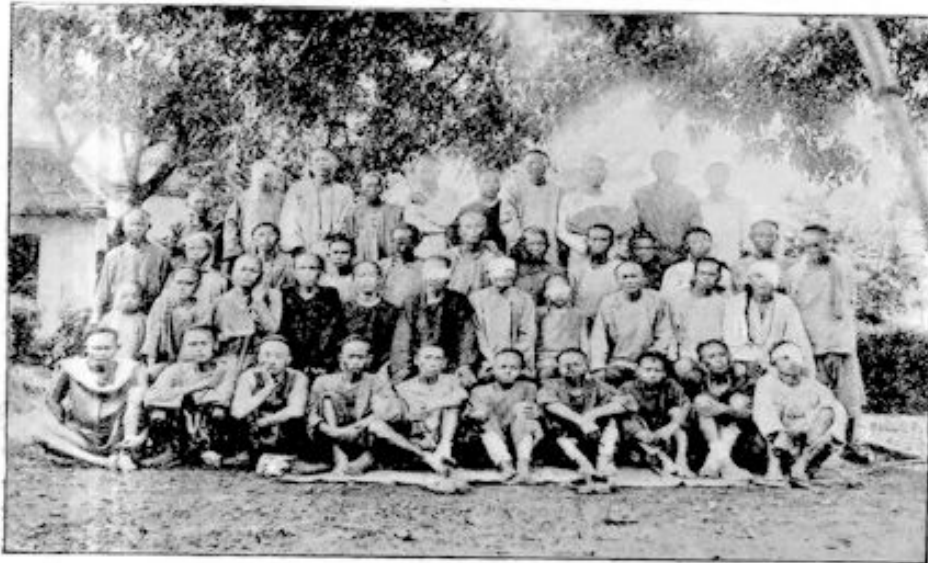
GROEP VAN PATIËNTEN BEHANDELD IN NEERBOSCH' HOSPITAAL.

ter tijd zeer vele zwakke kinderen onder en daar veler ouders aan tering waren overleden, zeide toen hij weer naar Utrecht zou vertrekken om zijn studie voort te zetten, met