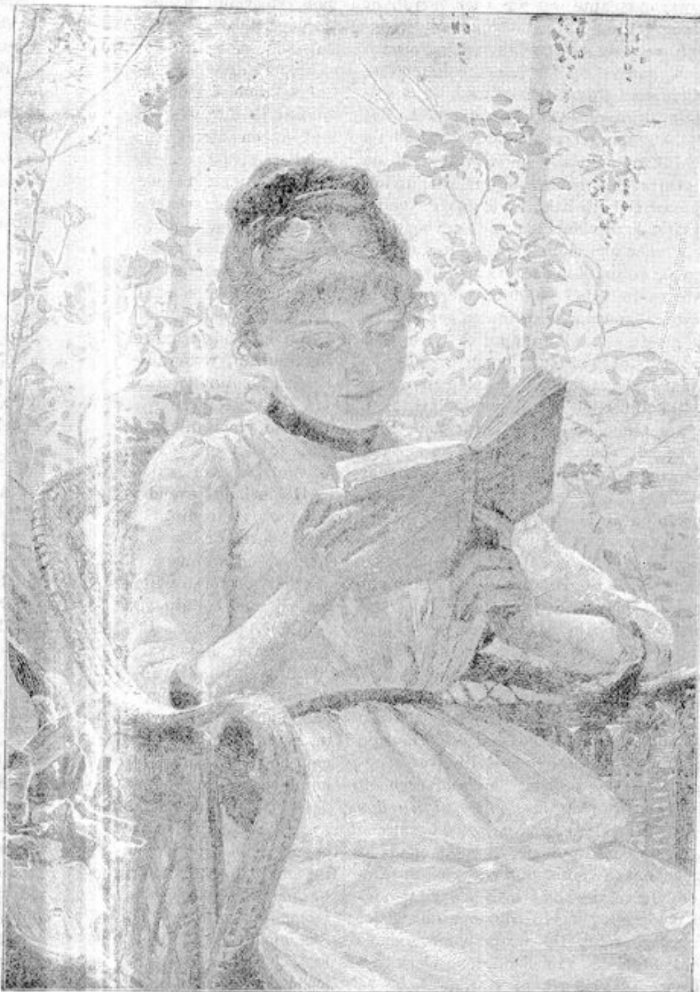
WAT LEEST ZIJ.