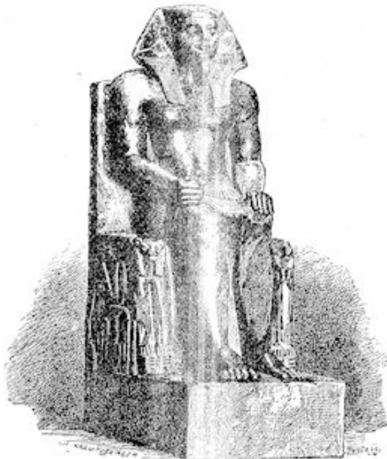
HET BEELD VAN CHEPHRON.

Ziehier een tweede beeld, dat ons den Sheikh-el-Beled te zien geeft. Het is niet van steen, maar van hout. Toen dit opge- haald werd uit zijn graf, waarin het duizenden jaren gerust had, en de werklieden het gelaat ontbloot hadden, riepen zij allen