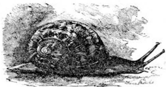
DE EETBARE SLAK.

In Limburg zijn er vele liefhebbers van slakken en er wonen aldaar menschen, die er een bijverdienste van maken, om slakken aan te kweken. Zij verzamelen hoofdzakelijk slechts ééne soort, de zoogenaamde Caracol, door de natuurkundigen Helix pomatia L. genoemd. Zie de kleine plaat. 't Zijn nog al groote slakken, grijsachtig van kleur, iets in 't groene spelend. De huisjes zijn rond, geelbruin met matkleurige roodbruine dwarsbanden. De slakkenkweekers verzame-