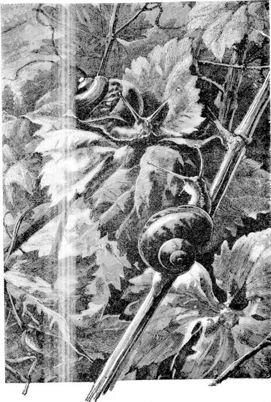
IETS VAN SLAKKEN.