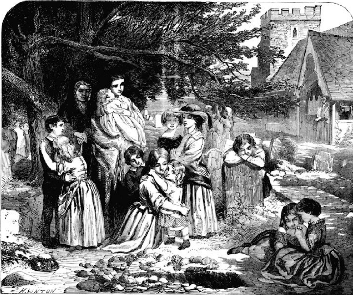
OP HET KERKHOF.

welks drempel zij ook uit eigen beweging nooit zou hebben overschreden. De Heere God had er haar overgebracht. Maar zij was er geheel onbewust van en haar man, zie, het was nu alsof er nooit iets tusschen die overburen was voorgevallen, zoo liep Stopnaald het huis van Zandwijk in en uit, alsof het het zijne was. Het zijne?.... ach! het stond nog in lichtelaai; en ook