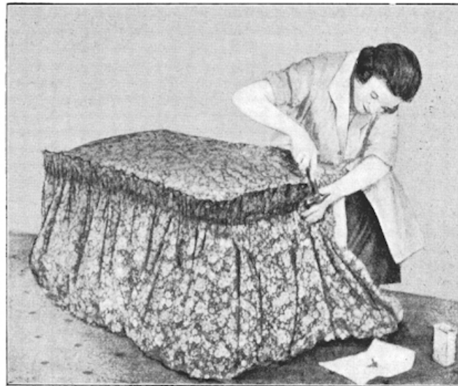
Nog even de buitenbekleding vastspijkeren.