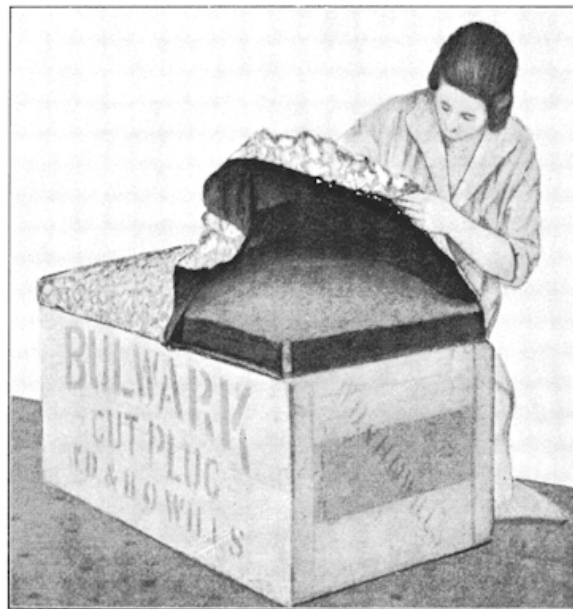
Het deksel is bijna klaar.

Het deksel eischt eenige meerdere verzorging. Men brengt er eerst een laag zegras of kapok op aan, aan 't eene eind dikker dan aan 't andere, en bevestigt deze met kruizelings vastgespijkerde, stevige banden. Dit om verschuiving van het materiaal te voorkomen. Hierover komt, goed strakgetrokken, de bekleeding. Is de bovenstof dun, dan doet men goed er eerst een voering overheen te spijkeren. De binnenkant van het deksel wordt bekleed gelijk de binnenkant van de kist. Men kan het deksel aan een kant bevestigen met scharnieren of met stevige reepen, gelijk men die wel ziet aangebracht onder de zittingen van vouwstoeltjes.