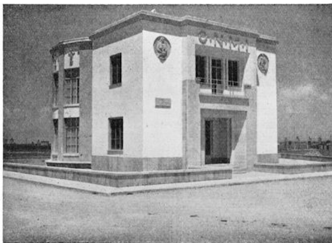
Voor moeder en kind.

Hoe hoog ook het ideaal van den Duce was en hoe geniaal de idee, toch duurde het lang eer zijn denkbeeld, dat wanneer een vrouw een kind heeft, zij nu ook recht heeft op hulp, tot de massa doordrong. Natuurlijk wordt de wettige vader opgezocht, wordt al het mogelijke gedaan om een huwelijk tot stand te