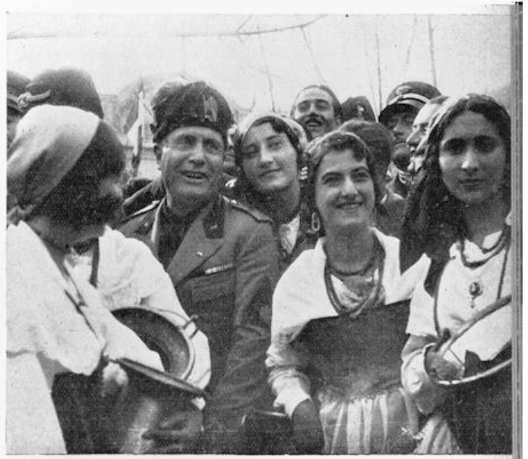
De Duce op een landelijk feest.