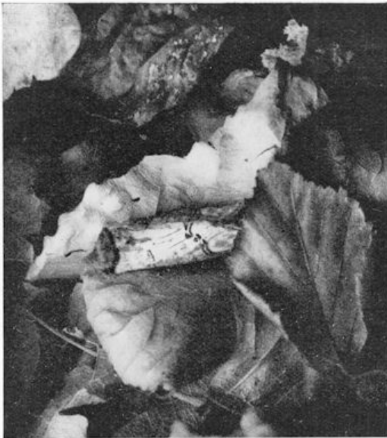
Wapendrager op dor blad.

Bescheiden in hun voorkomen zijn Nachtkoekoeksbloemen en Silene, zij verwachten dan ook voornamelijk de minder groote insecten, uiltjes en motjes. Is de Koekoeksbloem overdag ook nog wel te spreken, met de Silene is dat juist niet het geval, ze verborgt zich dan zooveel mogelijk door het totaal inschropelen van haar fijne, witte blaadjes, die pas laat in de avond zich strekken en dan fraaie kleine bloemen vormen. Het vermogen om zich schuil te houden wanneer de zon ons zijn licht zendt, is alle wezens die in het duister hun grootste activiteit vertoonen, min of meer eigen. Uilen en vleermuizen zoeken donkere hoeken op in torens en schuren, padden kruipen weg onder steenen of blad, bloemen verschrompelen tijdelijk of voorgoed en vlinders.. gaan rustig in het volle licht een dutje zitten doen. En toch vinden we ze niet, wat kan daar wel de oorzaak van zijn? Het is een combinatie van twee eigenschappen, namelijk hun kleur en het vermogen urenlang doodstil te kunnen zitten. Maar die kleur is wel het voornaamste, want niet alleen is ze onopvallend, doch