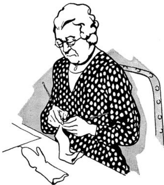
... en tante breide wanten.

„Ne bussel vloeipapier, Nonkel. Daar droog