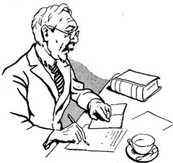
Oom berekende de uren....

En dan gaat gij toch ook mee, Leona? Ge zoudt saam voor de nota's kunnen zorgen.”