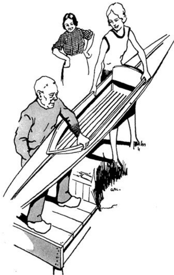
Ze droeg met den kloefmaker haar kano in 't water.

Ze zou er weer eens t' avond heen gaan en meehelpen. Er was veel nota-werk bij, wat ieder kon.